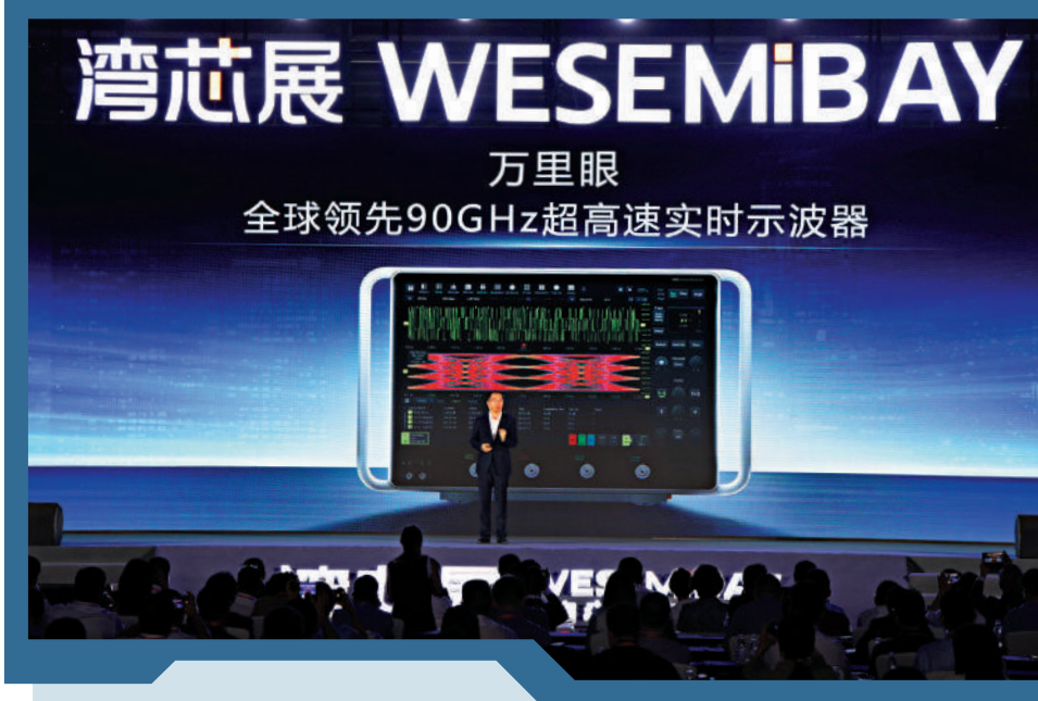
▲H200對中國客戶具有實際應用價值，目前國內雲廠基本都是用於訓練，國產AI芯片則多用於推理場景，二者並不直接衝突。圖為在2025灣芯展上，中國半導體企業新凱來旗下萬里眼自主研發的新一代超高速實時示波器正式發布。

相比閹割的H20，H200的性能大幅度領先，更容易獲得中國客戶青睞。對英偉達來說，H200銷售的利潤空間也要比H20理想，後者基於H100閹割而來，會增加製造端成本，而H200不需要做任何閹割，作為一款老產品，平均毛利率有望接近甚至超過80%。業內普遍預估，H200的算力在H20的8倍左右，而按FP16的紙面數