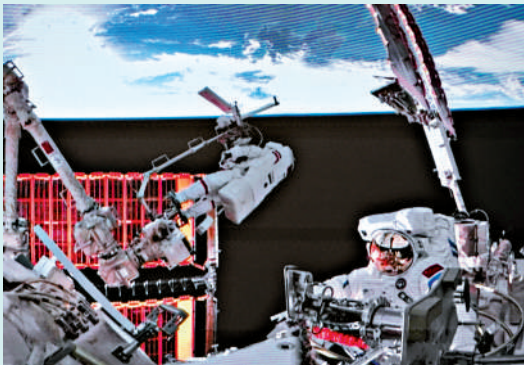
▲神飛二十一號乘組航天員張陸、武飛（右一）在艙外工作。

據中國載人航天工程辦公室介紹，12月9日10時28分，經過約8小時的出艙活動，神舟二十一號乘組航天員張陸、武飛、張洪章密切協同，在空間站機械臂和地面科研人員的配合支持下充分發揮在艙外第一現場的能動作用，順利完成了神舟二十號飞船返回艙舷窗巡檢拍照、空間站空間碎片防護裝置安裝、溫控適配器多層罩更換等任務。出艙航天員張陸、武飛已安全返回問天實驗艙，出艙活動取得圓滿成功。32歲的航天員武飛成為我國目前執行出艙任務的最年輕航天員。