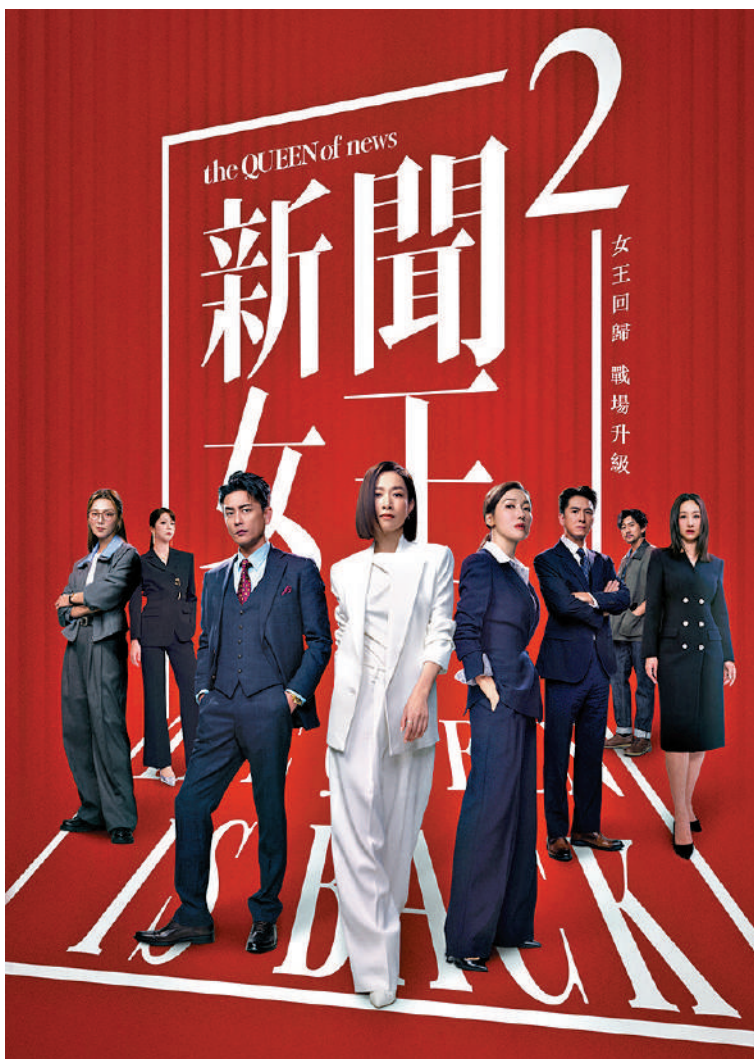
《新聞女王2》保留原班底核心主創，播出後持續有話題度。

《新聞女王2》延續並升級了TVB擅長的「探案+職業劇」模式，將專業敘事與現實思考融合，展現敘事張力。首集從新聞事件元朗舊樓倒塌展開，各方媒體出動無人機、直升機等直播事故現場，從之前的同台內鬥升級至傳統媒體與網媒的全行業博弈。劇集許多情節取材自真實事件，從塌樓事故到業主劫持案，還有貼近時事熱話的AI主播、錄音曝光等，精準鎖定新聞題材。有網絡評論提到，攝像機對準的不僅是劇集的橋段，也是被人們忽略的問題，引起觀眾們對社會事件的關注與反思。