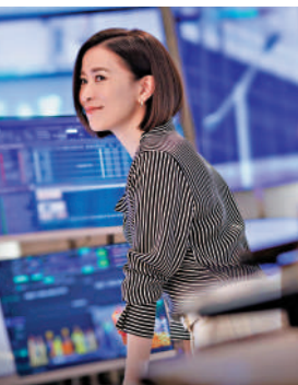
▲文慧心（佘詩曼飾）在第二輯中離開SNK，投身網媒。