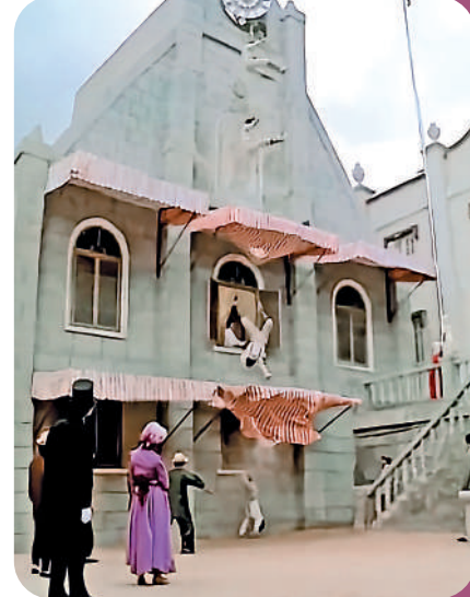
《A計劃》中跳鐘樓的動作，下方特製的簷篷是給演員卸力的工具。