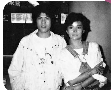
吳偉業（左）拍攝《警察故事》時與林青霞合照。