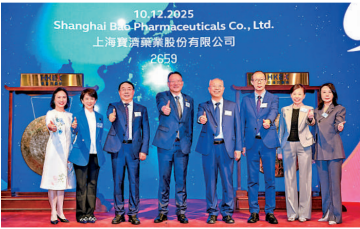
▲寶濟藥業首日上市，公司管理層及嘉賓出席敲鐘儀式。

另外，由京東集團（09618）分拆的京東工業（07618）今日上市，昨日暗盤「潛水」。參考最終發售價14.1元，三大