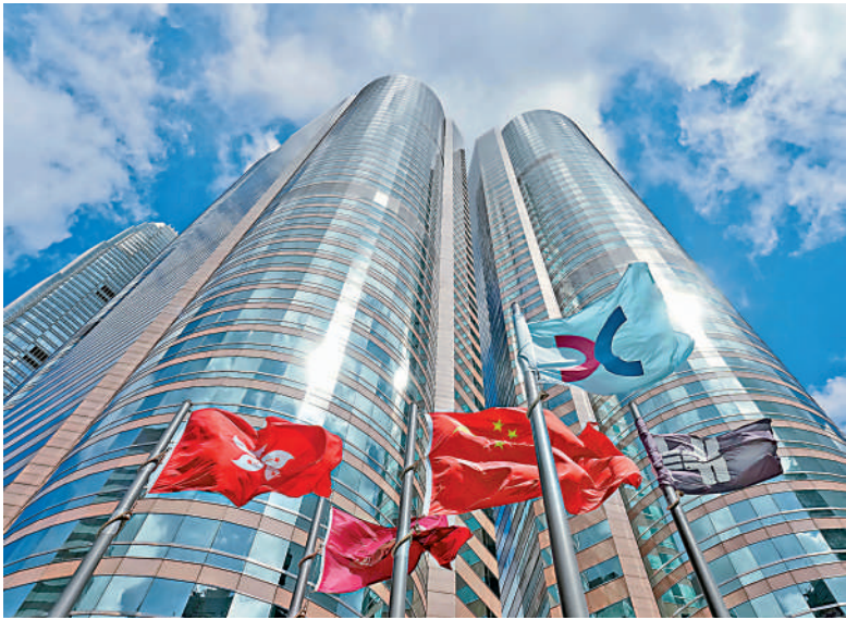
▲今年新股市況暢旺，料全年集資額超過2800億元，位居全球首位，新股數量介乎110至120隻。