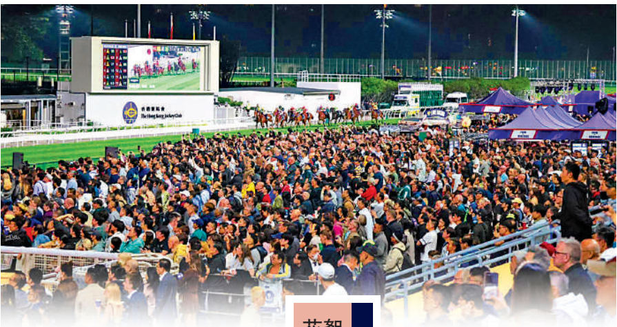
▲跑馬地馬場昨晚人山人海。