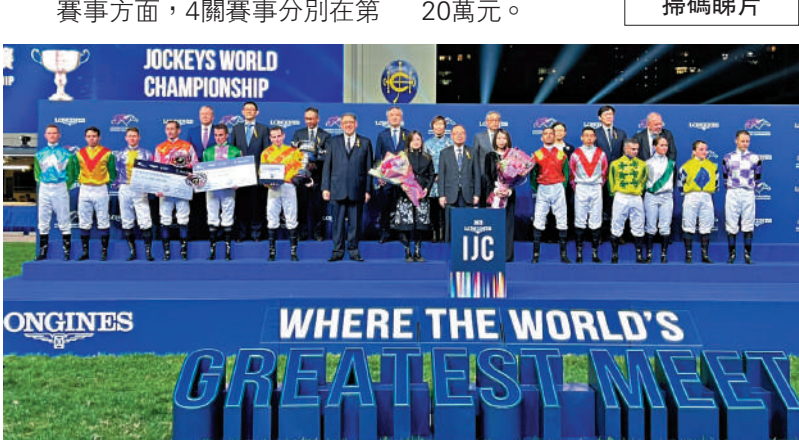
▲國際騎師錦標賽頒獎禮後大合照。

賽制方面，每關勝出騎師獲得12分，亞軍獲6分，季軍則得4分。冠軍騎師可獲60萬港元獎金，亞軍獲25萬元，季軍則是15萬元。