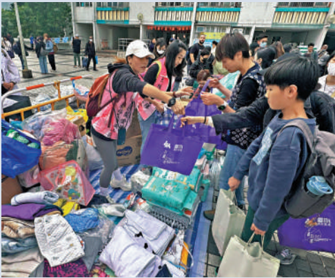
▲大埔宏福苑的一場大火，災民的私人財物盡失。