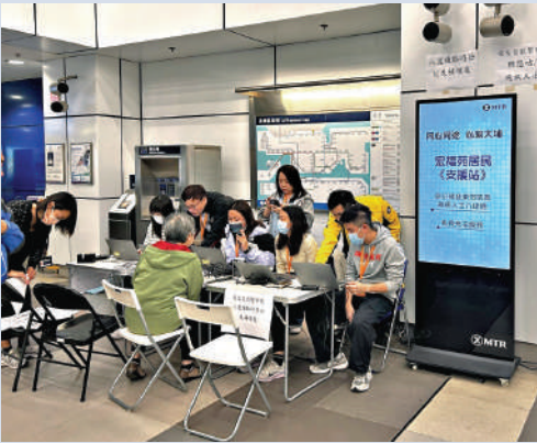
▲全港各界積極支援災後復原，以及社區重建工作。