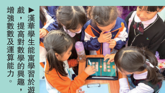
▲將程序設計與科學計算原理結合，打造實用場景工具。