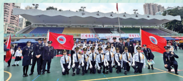
▲中、小學部國旗隊同獲升旗總會周年檢閱禮比賽一等獎。

漢華多年來實踐「機會、資源、鼓勵」的資優教育理念，致力將資優教育普及化。課堂着重培養學生4C能力，即明辨思考和解決問題能力、溝通能力、團隊共創及創新能力。教師團隊持續精進專業發展，設計多元校本課程，啟發學生潛能。資優教育不再局限於少數學生，而是讓每位學生都有機會發揮所長，追求卓越。