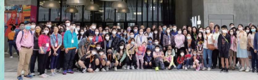
▲「親子大旅行」，前往M+博物館享受文化氣息，樂聚天倫。