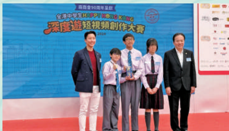
▲學生榮獲「全港中學生Happy Hong Kong深度遊短視頻創作大賽」亞軍。