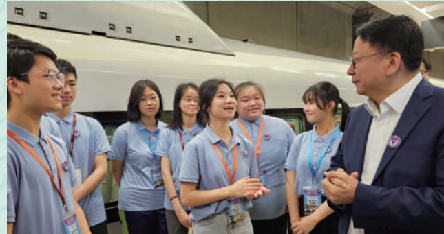
▲「公民與社會發展科內地考察」首發團。

漢華自1995年起率先在高中加入研學元素，舉辦內地考察課程，現與全國30多所姊妹學校建立深度交流。發展至今，研學結合各學科課程，讓學生親身體驗中華文化，加深對國家的認識與認同，同時透過實境教學有效掌握及鞏固課本知識。學校每年安排學生到內地不同地區研學，學習非遺文化，提升文化自信。隨著「一帶一路」倡議，學校更將研學足跡擴展至歐美及「一帶一路」國家，讓學生擁有全球視野。完成初中課程後，學生可選擇境外一年遊學，豐富學習經歷，培養國際胸懷。