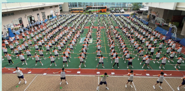
▲全校中學部同學參加校園武藝操實況短片比賽獲得全港冠軍。