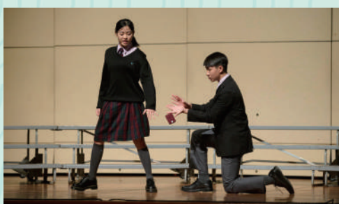
▲第76屆香港學校朗誦節中三及中四級英語Dramatic Duologue項目，同學以最高榮譽(Honours)奪得冠軍殊榮。

漢華推行「兩文三語」多年，英語授課成效近年有跨躍式進步。學校實施十二年連貫而全面的英語授課，中小學部多科以英語教學。英語課堂融入戲劇元素，設英文戲劇課程，結合古典故事，提升學習趣味。小學設英語生活式、體驗式教室，中學每級三班，兩班以英語授課，中小學部普通話教中文，有效提升學生語言能力及學科理解力。學校更安排外國交流團，到訪馬來西亞、澳洲等地，以拓闊國際視野。學生在英語公開試成績逐年提升，印證教學成效顯著。