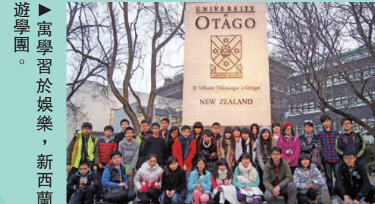
▲寓學習於娛樂，新西蘭遊學團。