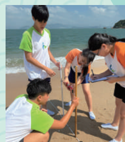
▲同學在長洲東灣測量海岸坡度。