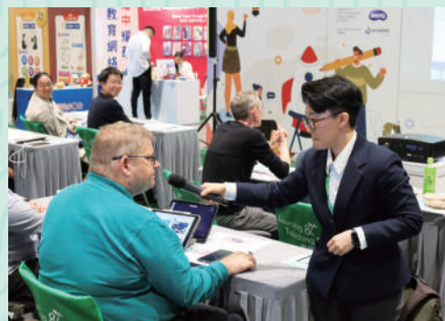
▲示範教學與外校老師交流經驗。