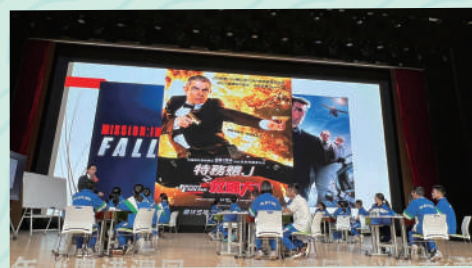
▲應教育局邀請前往廣州華南師範大學附屬中學，分享教學經驗，現場作公民與社會科高中示範課。