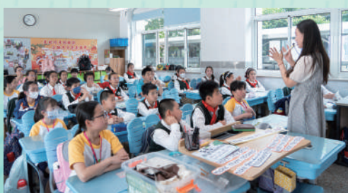
▲小學部前往內地姊妹學校南京市五老村小學交流。