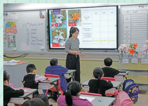
▲小學部科學科以英語為學習語言。