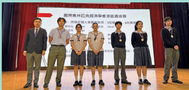
▲中學同學參加國際奧林匹克經濟學香港區選拔賽2024，榮獲3銀、6銅獎項。