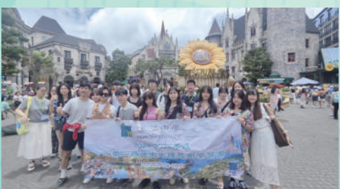
▲修讀歷史及地理的學生前往越南的會安古城進行歷史文化考察。