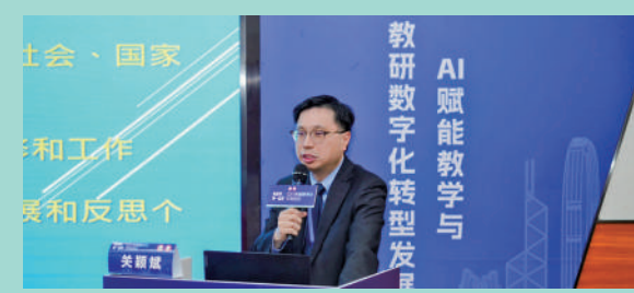
▲參加廣東省教育研究院主辦的「2025年粵港澳同一堂課：中小學智慧課堂交流活動」，分享香港和漢華中小學部「AI賦能教學以拓展學習空間」的實踐經驗。

漢華積極推動AI教育，從小一開始融入課程，設「AI科學探究」綜合課程，結合人文、科學、資訊科技等學科，引導學生認識人工智能對社會的改變，並學習合理及有道德地使用AI。學校在STAM課程中研發機械人、機械車項目，注入AI元素，提升學生創新及解難能力。AI與教學結合，增加教師教學效率，同時促進學生個別化學習。教師團隊積極開發AI教材，讓學生掌握未來技能，成為香港創科的新一代人才。