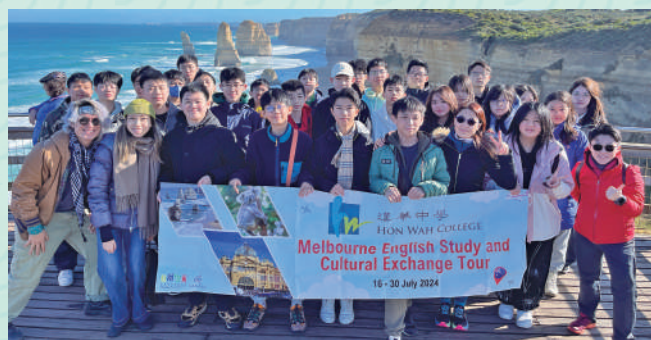
▲學生赴澳洲進行英語學習。