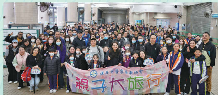
▲「親子大旅行」，前往M+博物館享受文化氣息，樂聚天倫。

漢華家長教師會自1957年成立，家長積極參與校務，促進學校發展及子女成長。家長教師會以「尊重、包容、平衡、互信」為宗旨，與學校保持緊密溝通，共同為學生創造最佳學習環境。校友會是學校強大後盾，全球來自香港、廣州、菲律賓、歐洲、加拿大等地逾萬名校友無私支持母校，捐資助學、擔任顧問、分享經驗，形成強大的支持網絡。家校校友三方合作，共同為學生成長及學校發展努力，是漢華成功的重要基石。