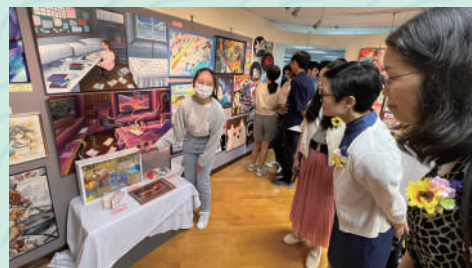
▲高中藝術科同學，舉行「我的世界我的夢」作品展。