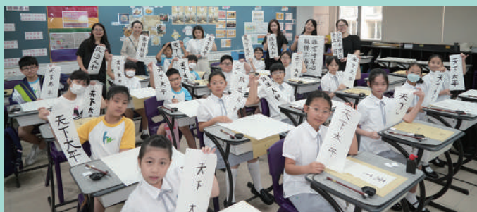
▲高小學生參與早前教育局舉辦的「千人揮毫賀國慶」香港中小學書法校本活動。

漢華擁有一支專業、創新且關顧學生成長的優秀教學團隊。學校支持教師持續進修，積極參與專業發展課程，不斷提升教學效能，並透過推行「教學跑出課堂」理念，每年舉辦全校學科考察日，鼓勵教師設計校本課程，將學習從課室延伸至社區，激發學生學習熱情。教師團隊合作無間，共同備課、觀課及評課，營造專業學習社群。中小學部老師更與院校交流，分享教育教學經驗，拓闊教學視野。班主任辦公室設於班級同層，方便師生溝通，建立深厚感情。教師不僅傳授知識，更以身作則，培養學生品格，深得家長信任與讚許，成為學校成功的關鍵力量。