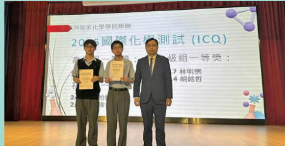
▲中學部參加由澳洲皇家化學學院(Royal Australian Chemical Institute, RACI)舉辦的2025國際化學測試獲得一等獎。