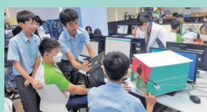
▲將程序設計與科學計算原理結合，打造實用場景工具。