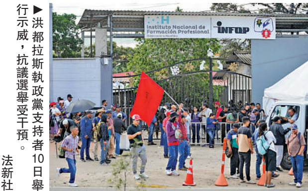
▲洪都拉斯執政黨支持者10日舉行示威，抗議選舉受干預。

洪都拉斯大選前，特朗普曾發文公開支持阿斯富拉，並威脅洪都拉斯選民稱，若阿斯富拉敗選，美國將削減對洪都拉斯的援助。在計票工作仍在進行之際，特朗普又稱若阿斯富拉的領先結果有所變動，洪都拉斯將「付出慘痛代價」。