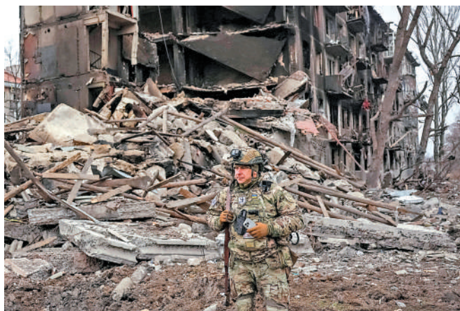
▲頓涅茨克地區建築9日在俄烏衝突中被摧毀。

俄國防部11日說，俄軍前一夜擊落了287架烏克蘭無人機，其中32架飛往莫斯科方向。受無人機襲擊影響，莫斯科4個機場一度暫時關閉，數十個航班被取消或推遲。