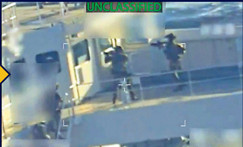
▲美軍士兵持槍在油輪上進行搜查。

美國總統特朗普10日稱，美軍當天在委內瑞拉附近海域扣押一艘大型油輪，並且將「留下」油輪上的石油。美方稱，扣押理由是該油輪「受到美國制裁」。石油出口是委內瑞拉主要收入來源之一。委政府強烈批評美方的「無恥盜竊」以及「國際海盜行為」，斥特朗普圖謀掠奪委能源。美媒稱，此次事件是特朗普向委總統馬杜羅施壓行動的「重大升級」。受油輪被扣押消息影響，原油期貨價格上漲。