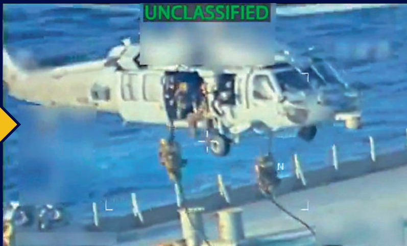
▲美軍士兵通過繩索降落到油輪甲板。