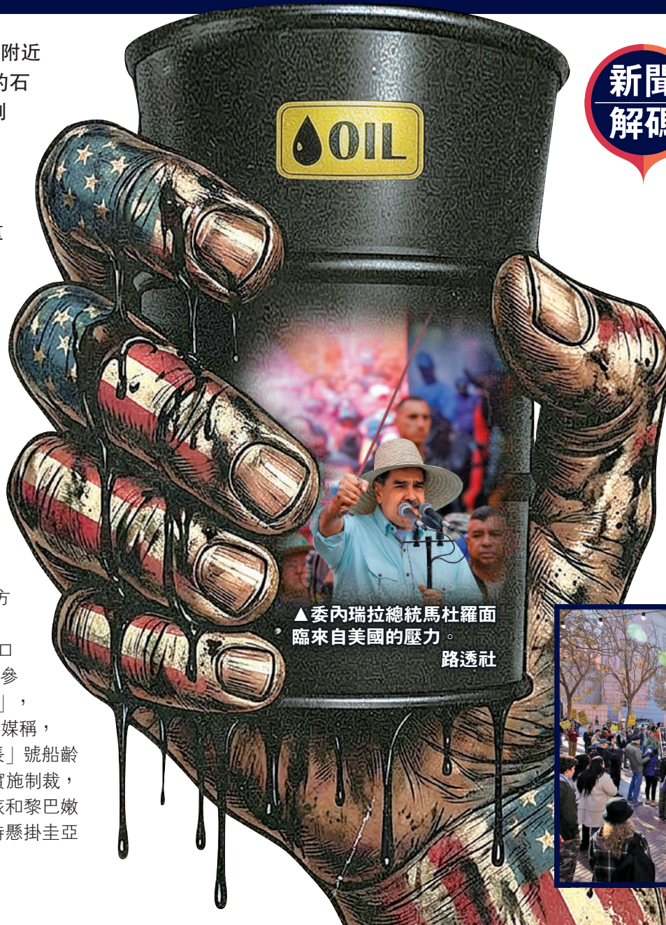
▲委內瑞拉總統馬杜羅面臨來自美國的壓力。