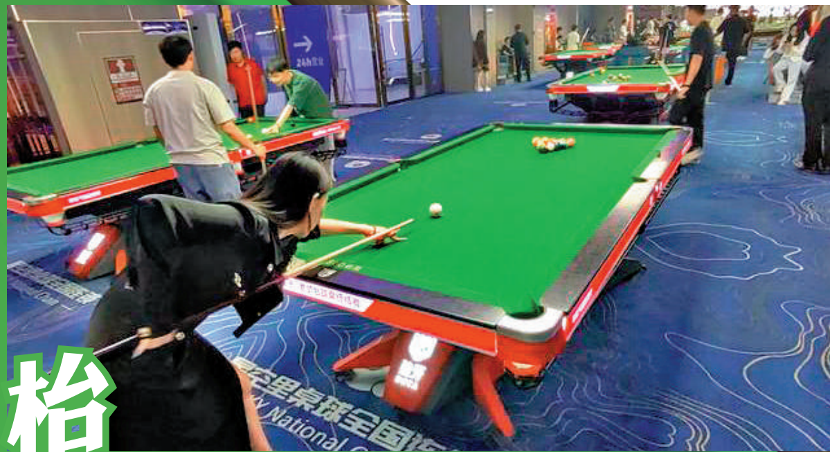
枱球助教因為收入高工作輕鬆，吸引了年輕女生應聘。

然而，這條產業鏈背後的監管卻面臨重重難題。公安機關的工作人員對記者表示，枱球廳的屬性界定模糊成為最大阻礙，根據《娛樂場所管理條例》，主要監管對象是KTV、酒吧等，枱球廳並不在其調整範圍內。多數枱球廳僅以「體育經營」進行備案，「巧妙」地規避了更嚴格的娛樂場所監管。這使得一些枱球廳容易出現打擦邊球的行為，卻又難以受到有效約束。枱球廳「灰色產業鏈」不僅損害消費者利益，也影響行業健康發展。相關部門應盡快明確枱球廳的屬性界定，完善監管機制，讓枱球廳回歸正常。