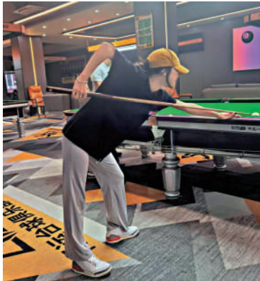
▲枱球成為年輕人熱衷的運動。

對於助教行業，俱樂部老闆也有着自己的看法。一位老闆坦言，助教在工作之外的行為，枱球廳實在難以干涉。這也反映出，助教行業的規範和管理存在一定的複雜性。