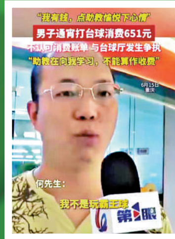
枱球消費易生紛爭，看法兩極。

選妃一樣叫助教」，助教服務經其同意；丁先生則堅稱沒人提過收費。事件發酵後，涉事企業山東鼎鼎體育產業集團對相關人員作出處分，被網友視為「變相承認管理漏洞」。業內人士指出，此類糾紛隱藏低價引流、隱性加項、暴力逼單三重套路。浙江豐國律師事務所李律師表示，店家未明碼標價涉嫌違法，丁先生初期的露骨私信也引發網友對其「動機不純」的質疑。