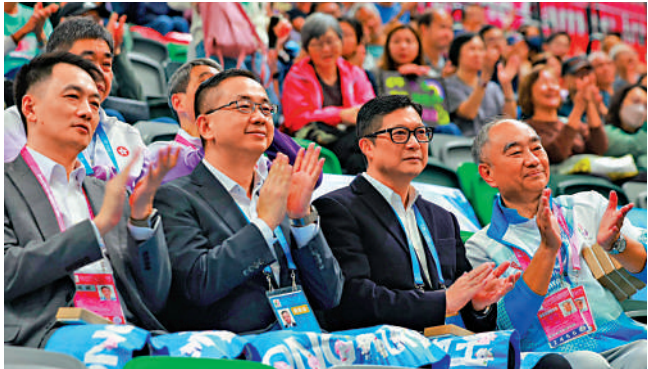
▲鄧炳強（右二）在觀眾席上為選手落力表現鼓掌以示支持。