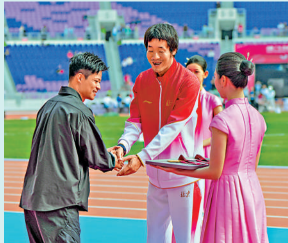
▲蘇炳添（左）與跳遠得獎選手握手。

【大公報訊】記者敖敏輝廣州報道：12日，剛剛宣布退役的「亞洲飛人」蘇炳添現身全國殘特奧會田徑賽場。他以頒獎嘉賓的身份，為男子跳遠T13級決賽獲獎選手頒發獎牌。蘇炳添表示，殘疾運動員的意志力比健全人更堅強，應該向他們學習，互相尊重。他還呼籲社會各界要給予殘疾運動員更多關注，提供更多訓練保障。