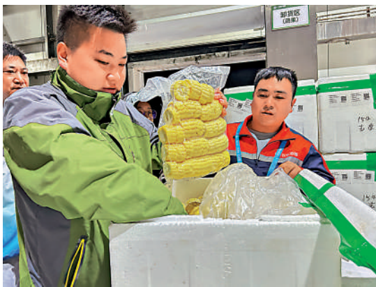
▲工作人員正在對即將出倉的運動員食材進行最後一道檢查。 ▲專業人員正在對瓜果蔬菜等進行農殘檢測。