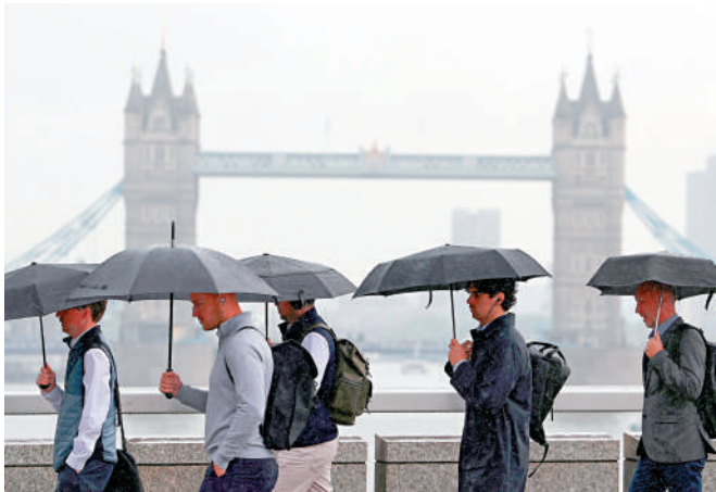
▲英國經濟持續萎縮。圖為倫敦街頭撐傘的民眾。

與此同時，與最新預算案一同發布的數據顯示，從明年至2029年年底的經濟增長預期已被下調，相當於從政策層面承認了當前英國經濟復甦的脆弱性。