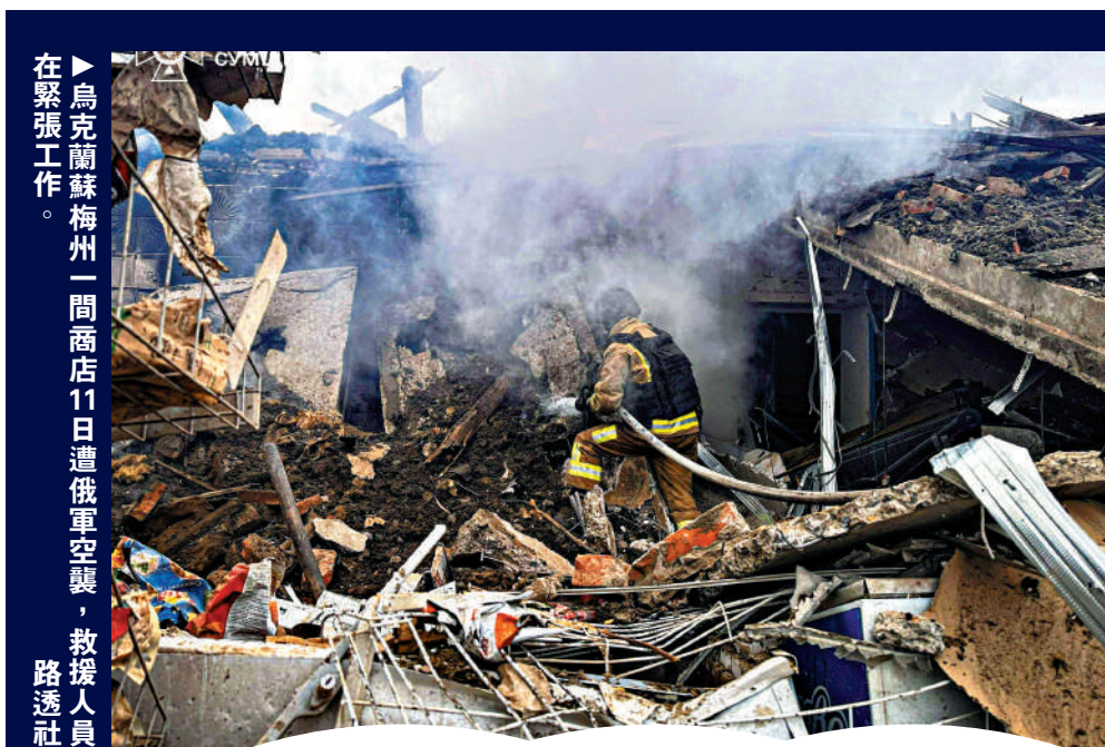
▲烏克蘭蘇梅州一間商店11日遭俄軍空襲，救援人員在緊張工作。

特朗普11日表示，美國此前與俄烏雙方「已非常接近達成協議」，更特別點名澤連斯基，稱除了他，烏克蘭民眾都很喜歡美方提出的協議。兩名知情人士透露，特朗普認定烏克蘭目前在戰場處於弱勢，近期烏總統辦公室前主任葉爾馬克因涉嫌腐敗