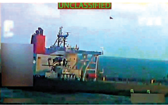
▲美軍直升機10日在委內瑞拉附近海域逼近一艘油輪。

中國外交部發言人郭嘉昆12日表示，中方堅決反對缺乏國際法依據、未經聯合國安理會授權的非法單邊制裁和「長臂管轄」，反對濫施制裁。