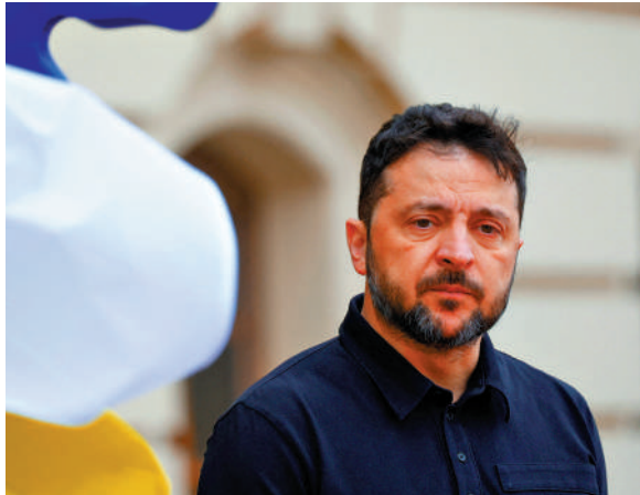
▲烏克蘭總統澤連斯基。路透社