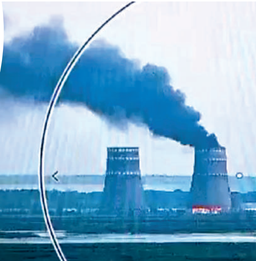
▲2024年8月，扎波羅熱核電站冷卻塔發生火災。