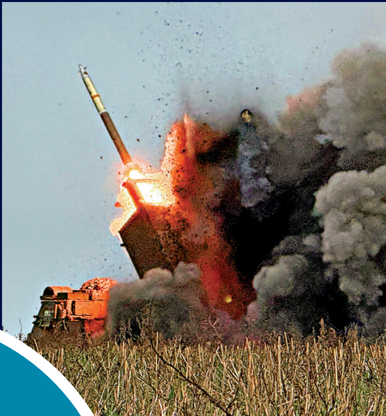
▲烏克蘭軍人在頓涅茨克前線城鎮波克羅夫斯克，向俄軍發射多管火箭炮。