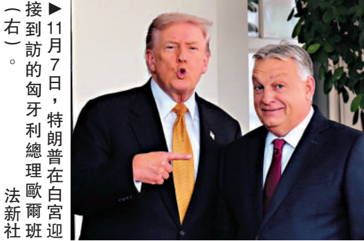
▶11月7日，特朗普在白宮迎接到訪的匈牙利總理歐爾班。

白宮本月4日發布美國國家安全戰略報告，聚焦美國「核心國家利益」，強調西半球優先，尖銳批評歐洲，警告其因移民政策等原因面臨「文明消亡的嚴峻前景」，稱美國對歐政策應優先考慮「幫助歐洲糾正其當前發展軌跡」。