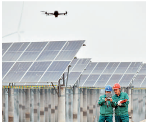
▲國網滄州供電公司的工人在一處「漁光互補」光伏發電場使用無人機巡檢。