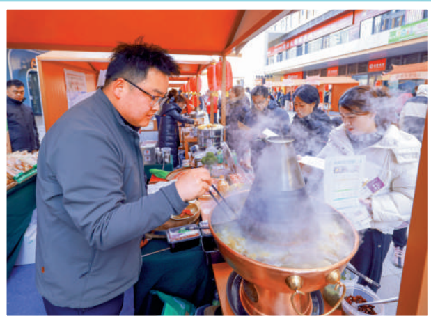
▲12月7日，北京市「昌平區2025年涮肉美食節」吸引大量遊客，商家烹製涮肉供市民品嚐。

針對房地產市場，韓文秀表示，要着力穩定房地產市場，因城施策，控增量、去庫存、優供給，鼓勵收購存量商品房重點用於保障性住房等合理用途，深化住房公積金制度改革，有序推動安全、舒適、綠色、智慧的「好房子」建設，加快構建房地產發展新模式。要積極有序化解地方政府債務風險，督促各地主動化債，嚴防虛假化債、數字化債，不得違規新增隱性債務，要加大金融財政支持力度，優化債務重組和置換辦法，多措並舉化解地方政府融資平台經營性債務風險。要穩妥推進地方中小金融機構風險化解，充實風險控制資源和手段，強化早期干預和處置，牢牢守住不發生系統性風險的底線。