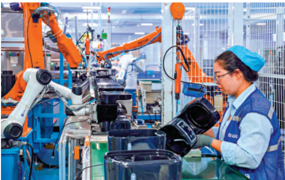
▲在廣東民營企業新寶電器股份有限公司，工人在數字化智能升級後的滴漏咖啡機產線上作業。