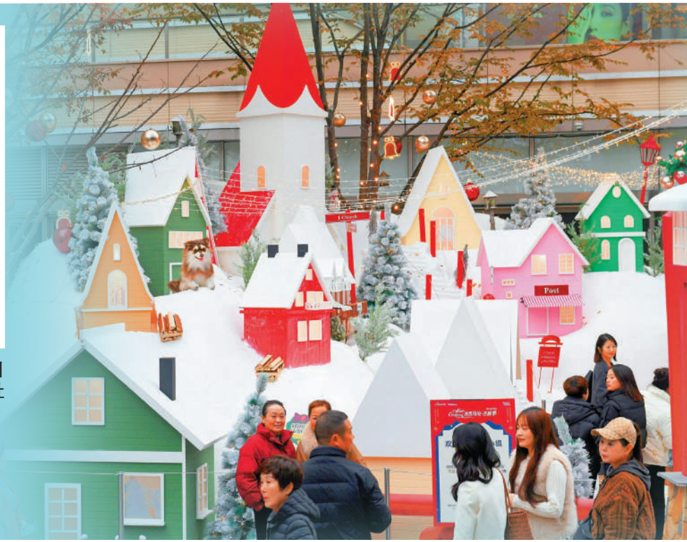
▲明年經濟工作重點之一，是要深入實施提振消費專項行動。圖為12月9日，重慶一商圈打造的「雪山小鎮」吸引遊人邂逅冬日浪漫「雪景」，激發冬日消費活力。