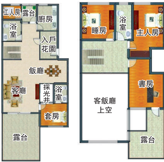
▲水映山岸公館208平米四房兩廳複式戶型圖。

高端豪宅 作為蛇口半島2015年建成的次新豪宅，水映山岸公館（別名林語堂）以「低密高綠+山海資源」的獨特定位，成為深圳高端改善市場的標桿項目。項目距離地鐵東角頭站僅約450米，4站直達后海總部基地。 項目佔地5092平米，建築面積1.8萬平米，