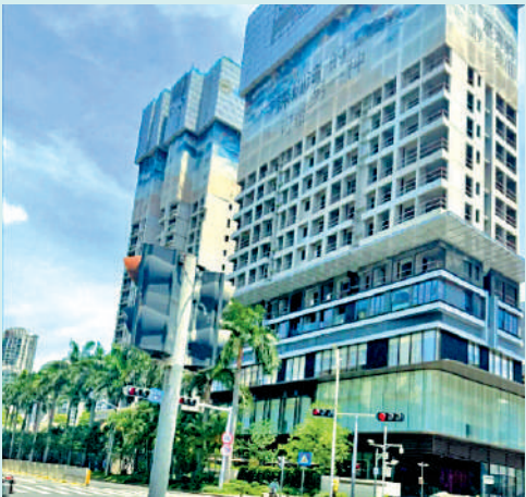
◀招商望海玥家園為招商漁二村舊改項目，由兩幢住宅樓及一幢公寓樓組成，預計後年入伙。

舊改項目 招商望海玥家園位於蛇口老城區，毗鄰半島城邦、南海玫瑰等豪宅區，項目享有蛇口濱海設施，如歌劇院、漁人碼頭、濱海長廊。由於地理位置優越，與中信東角頭項目、半島城邦五期並稱「最值得打的三大新盤」。