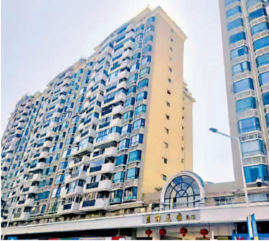
▲藍漪花園共14幢住宅物業，於2002年建成。