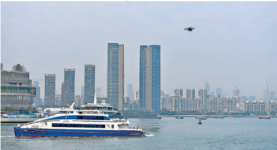
◀深圳南山區推動蛇口漁港及街道城市更新，打造宜居宜業的理想居住地。

灣區置業 漫步深圳蛇口漁人碼頭，海風輕拂，蘆葦搖曳，燈塔靜立如海岸守望者。昔日漁船穿梭、市集喧囂的場景雖已隨着舊區改造消散，但新規劃正在重塑：漁港核心區優化卸貨碼頭與交易市場，濱海生態帶西延深圳灣15公里休閒帶，漁文化體驗區建設世界經濟魚類海洋館。 該片區樓盤選擇多元化，招商望海玥家園等新盤每平米均價6萬元（人民幣，下同），而華僑城深圳灣新璽名苑以每平米均價13.9萬元領跑高端市場，金眾·雲山海公館則以7.5萬元坐鎮中端住宅主流。 大公報記者 毛麗娟深圳報道