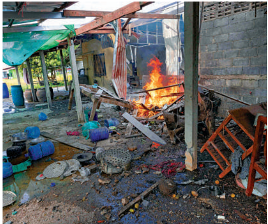
▲泰國安全部隊稱，素林府一處房屋遭柬埔寨空襲損毀。

截至目前，本輪邊境衝突已導致泰柬兩國約50萬人流離失所。根據泰國國防部的數據，雙方已有包括十多名平民在內的25人喪生。