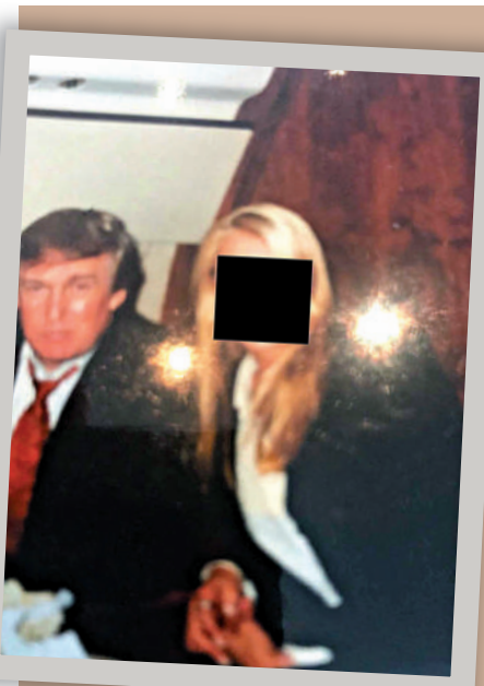
▲特朗普與一名女子坐在一起。