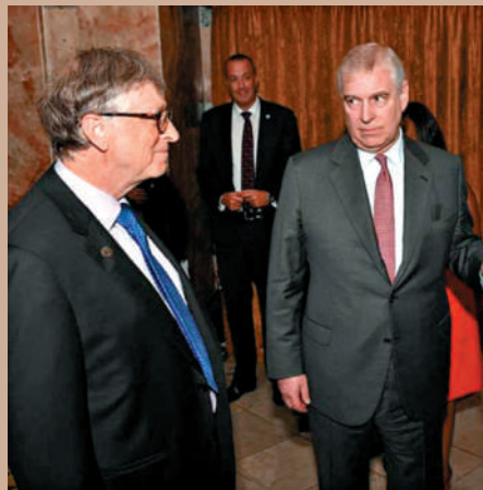
▲曝光的照片中包括比爾·蓋茨（左）與英國安德魯王子的合照。