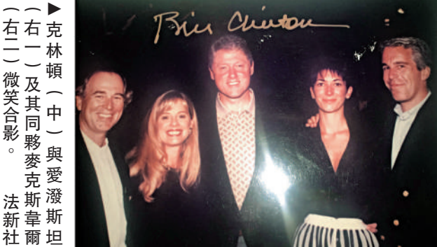
▲克林頓（中）與愛潑斯坦（右二）及其同夥麥克羅斯韋爾（左一）及同夥麥克羅斯韋爾（右二）微笑合影。

●克林頓自上世紀90年代初與愛潑斯坦相識並交好，曾多次乘坐愛潑斯坦的私人飛機出行。克林頓發言人早前表示，克林頓「對愛潑斯坦的滔天罪行毫不知情」，從未去過愛潑斯坦的島嶼，並且在愛潑斯坦2019年被捕時已有約20年沒有與他交談過。