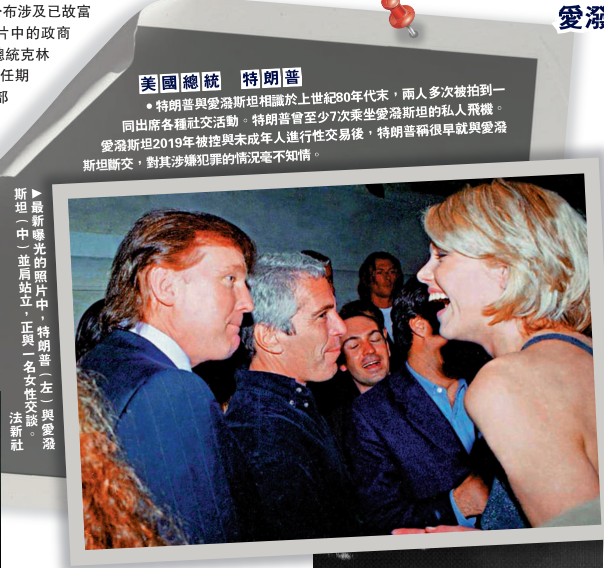
▲最新曝光的照片中，特朗普（左）與愛潑斯坦（中）並肩站立，正與一名女性交談。

報道稱，在此次公布的這批照片中有一張克林頓的簽名照，他與愛潑斯坦及其同夥麥克羅斯韋爾微笑合影。克林頓的發言人早前表示，克林頓對愛潑斯坦的罪行毫不知情，並且在愛潑斯坦2019年被捕前已有約20年沒有與他交談過。