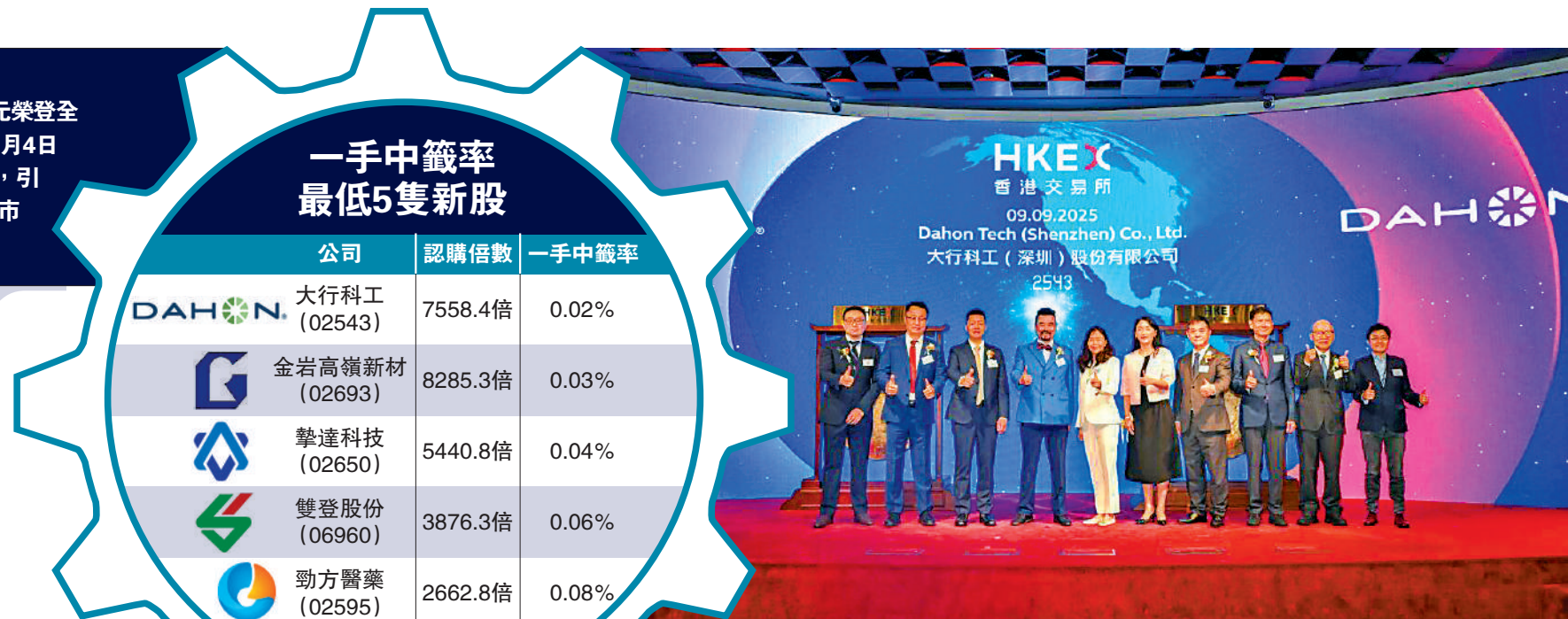
▲優化新股回補機制生效後，散戶分配大減，其中大行科工一手中籤率僅0.02%。

除了散戶中籤難之外，市場另一特點在於「獲利預期更強」。數據顯示，今年首11個月共有