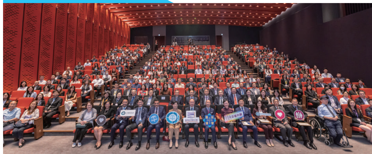
▲出席「通用設計嘉許計劃」嘉許典禮的嘉賓及得獎處所代表合照。