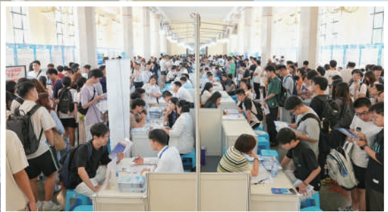
▲湖南引才活動吸引廣大高校畢業生踴躍參與 傅聰 攝

◀ 9月27日，「智匯瀟湘 才聚湖南」2025年湖南省促進高校畢業生就業創業專場招聘活動(上海站)在上海展覽中心啟動。 傅聰 攝