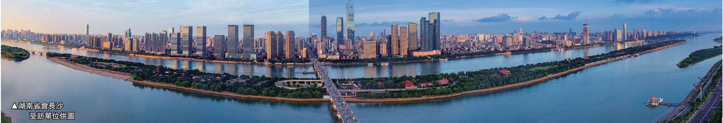
▲湖南省會長沙 受訪單位供圖