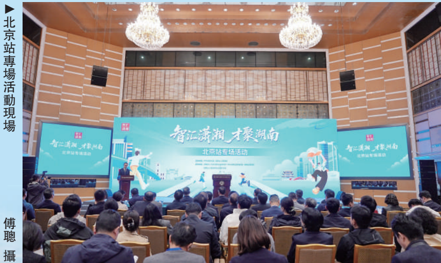
▶北京站專場活動現場