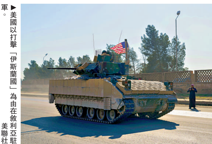
▲美國以打擊「伊斯蘭國」為由在敘利亞駐軍。

美媒稱，這是去年12月阿薩德政權倒台以來，首次發生美國士兵在敘利亞遇襲身亡事件。特朗普13日稱，美方將對此進行「嚴厲的報復」。美國目前以打擊「伊斯蘭國」為由在伊拉克和敘利亞保留少量駐軍，但特朗普政府希望從這兩國撤軍。