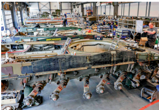
◀德國軍工巨頭萊茵金屬的僱員在組裝坦克。