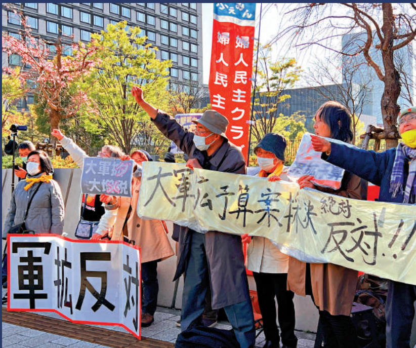
▲日本民眾2023年抗議增加防衛費。