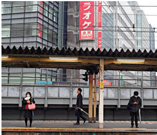
▲日本經濟不景氣，增加防衛費勢必影響民生。

法國學者艾默里克·蒙維爾指出，日本右翼勢力試圖通過修改日本憲法、解禁集體自衛權開展對外干預，公然推動日本重新軍事化，這些都是對國際關係基本準則的嚴重背離。中