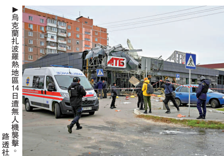
▲烏克蘭扎波羅熱地區14日遭無人機襲擊。

澤連斯基還表示，已告知烏最高拉達的議員們做好不久後可能舉行選舉的預案，「最重要的是，我不會固守總統職位，我認為烏克蘭應準備好應對任何變化」。特朗普日前批評澤連斯基以戰爭為由迴避選舉。澤連斯基稱，如果美歐協助保障選舉安全，烏方願在90天內舉行選舉。