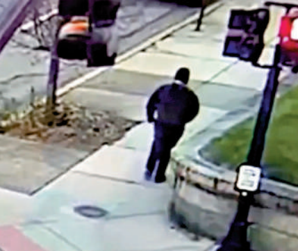
▲警方公布的嫌犯畫面。

人仍未被拘留，被批擾亂辦案流程。美國「槍支暴力檔案」網站最新統計顯示，截至14日，美國今年已發生至少389起大規模槍擊（除槍手外4人以上受傷或死亡）事件。