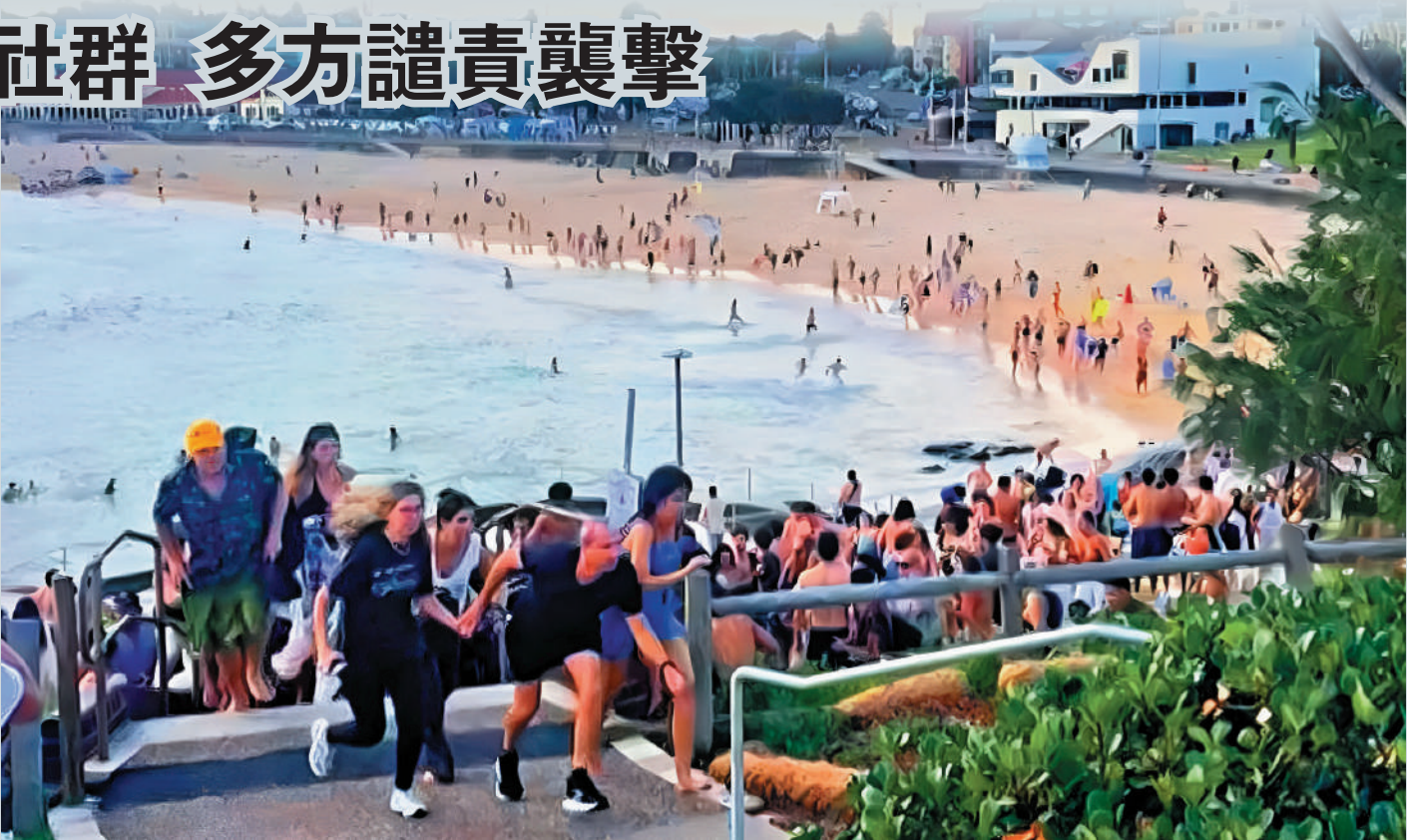
邦迪海灘14日發生槍擊事件後，人群四散逃離。