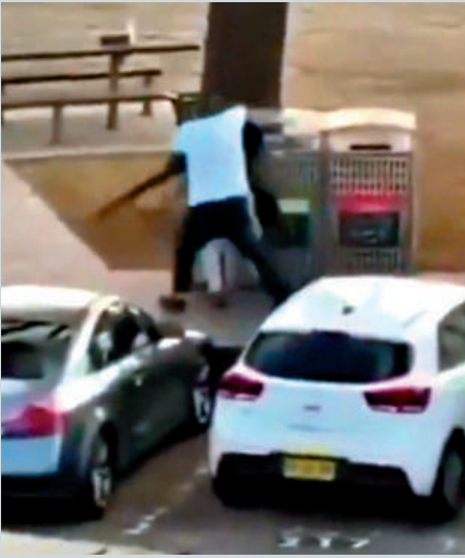
英勇路人徒手奪槍