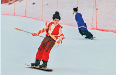
▲內地近日印發通知，鼓勵金融機構支持消費新業態新模式新場景建設。

商務部財務司負責人稱，下一步將推動相關舉措落地生效，更大力度支持惠民生和提振消費。