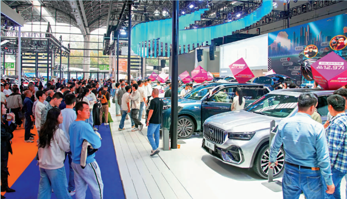
▲內地近日印發通知，加強商務和金融協同，因地制宜推動新型消費發展。圖為12月11日，民衆在南寧東盟國際車展參觀。 新華社

今年中央經濟工作會議，將「堅持內需主導，建設強大國內市場」，列為2026年經濟工作八大重點之首。而在擴大內需的部署中，又是雙管齊下，一是優化「兩新」政策實施，二是優化實施「兩重」項目。 長期以來，消費、投資、出口，被譽為支撐中國經濟的「三駕馬車」。在單邊主義、保守主義、經貿霸凌、地緣衝突等多重因素疊加的大環境下，國際經貿鬥爭形勢日趨複雜，出口承壓嚴峻。由消費和投資共同組成的內需，成為經濟發展的基本動力和主要依託。 「兩新」與「兩重」，恰恰就是對應着消費和投資。「兩新」，指的是「推動新一輪大