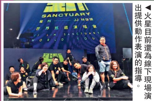
▲火星目前還為線下現場演出提供動作表演的指導。