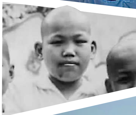
▶火星學戲出身，14歲入行。