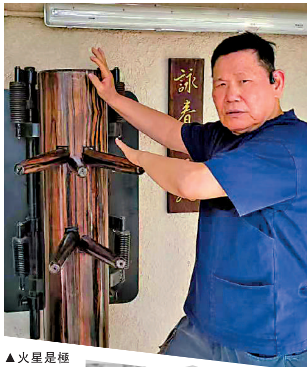
▲火星是極少數從上世紀六七十年代一路做到今天的特技人。