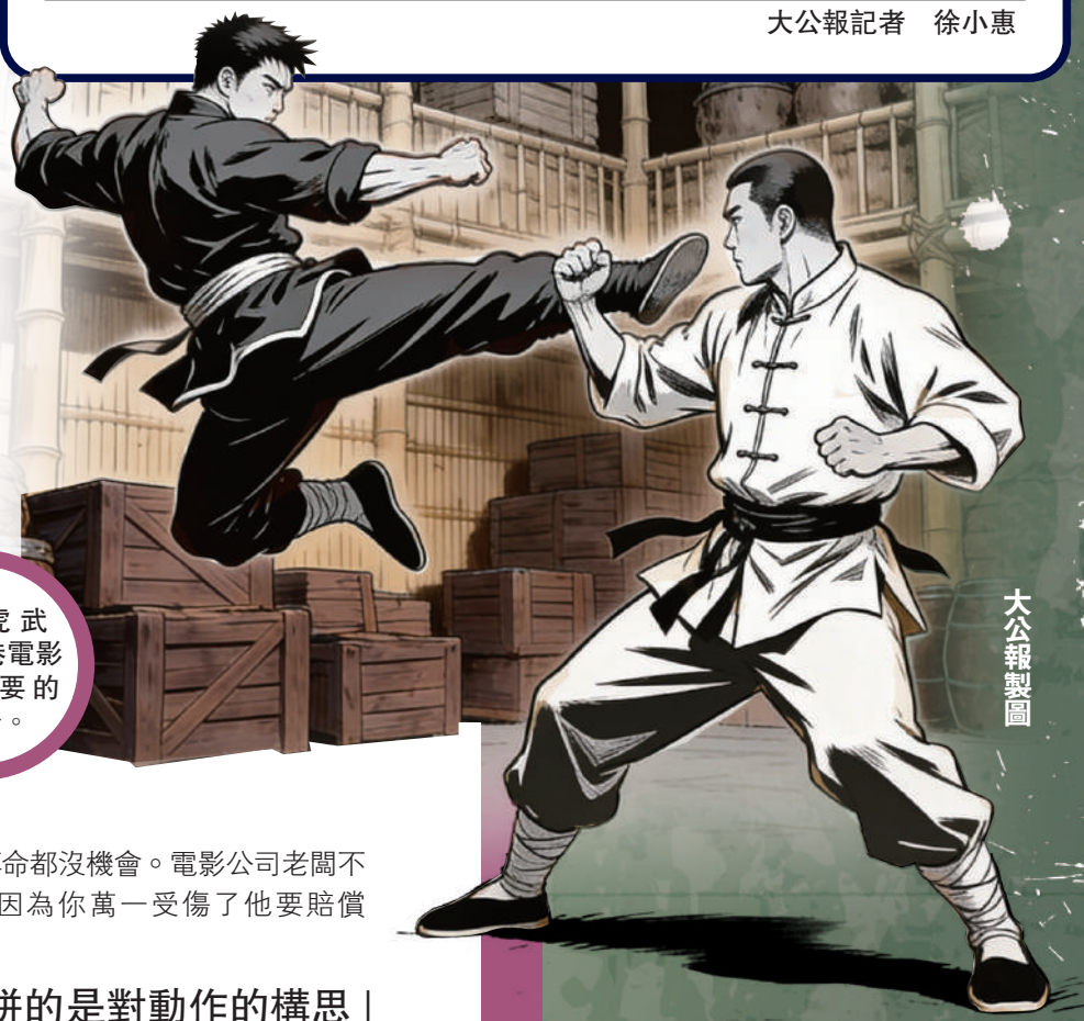
▲龍虎武師是香港電影十分重要的一部分。

說，「現在你想搏命都沒機會。電影公司老闆不會讓你搏命，因為你萬一受傷了他要賠償你。」