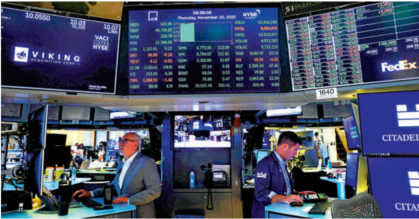
▲美國科技股進入估值下修周期，資金逐步撤退，美股面臨巨大調整壓力。

不過，更重要的是，美國科技龍頭股價呈現走弱趨勢，例如英偉達股價從年內歷史高位回調17%，預示美國科技股進入估值下修周期，資金逐步撤退，