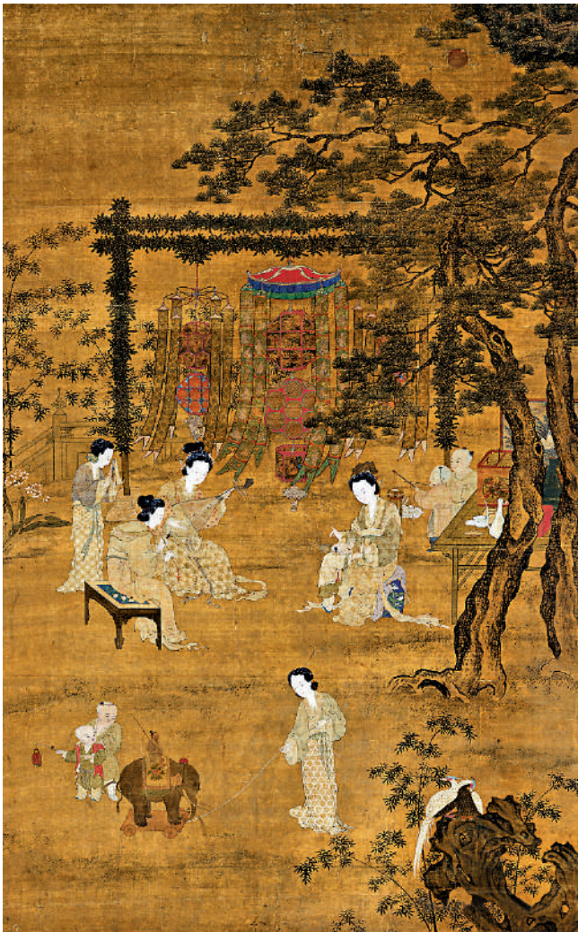
◀《觀燈圖》(南宋 李嵩繪)。