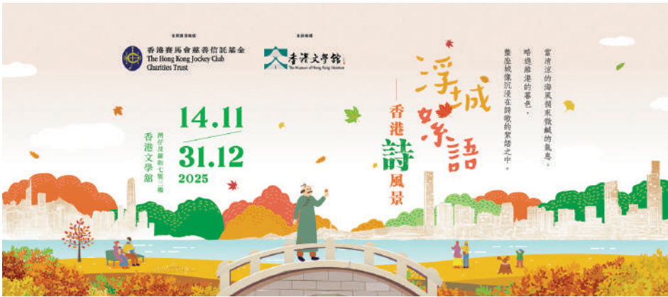
▲「浮城絮語——香港『詩』風景」展覽海報。