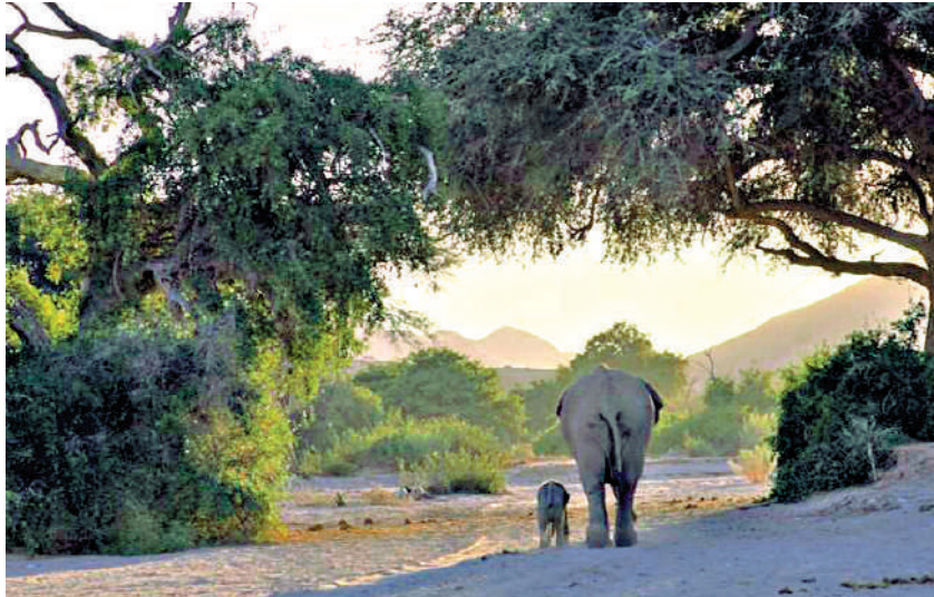
◀《沙漠小象走天涯》劇照。