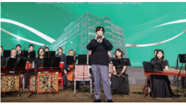
▲中樂演奏《樂韻飛揚賀華誕》。