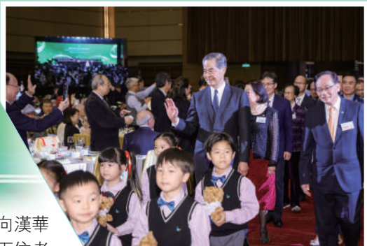
▲小學部禮儀大使引領主禮嘉賓進場。