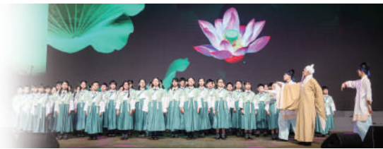
▲小學部合唱團歌舞劇表演《孔子與弟子跨時空相遇》。