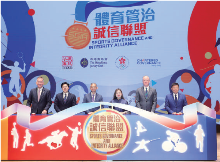
▲香港特區政府文化體育及旅遊局局長羅淑佩（右三），香港特區立法會議員兼港協暨奧委會副會長霍啟剛（左二），廉政專員胡英明（左三），馬會保安、誠信審查及資訊安全事務執行總監唐德誠（右二），香港公司治理公會會長司馬志（左一）及港協暨奧委會義務秘書長楊祖賜（右一），今年8月出席體育管治誠信聯盟啟動禮。

括，為每個體育總會提供最高10萬港元的資助，以獲取法律、會計及審計等專業服務，增強其體育管治和誠信的機制；由馬會保安、誠信及資訊安全部舉辦研討會和工作坊，加深持份者對體育管治及誠信最佳實踐的認識，並向有關持份者介紹全球相關範例。