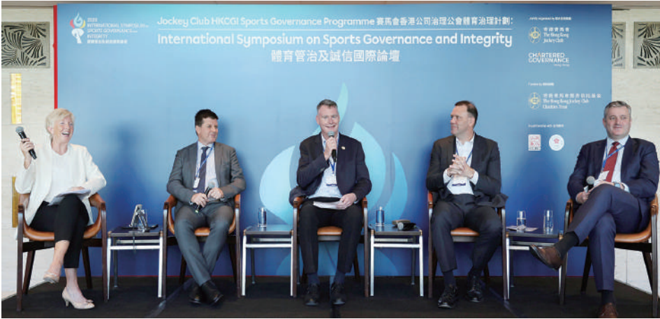
▲來自不同國家和城市的體育專家，就有關體育管治的最佳實踐進行討論。

馬會行政總裁應家柏在論壇上分享，指公平、誠實和遵守規則的核心價值，對體育的成功及未來社區至關重要。他稱，誠信是馬會的基石，馬會一直致力成為全球良好管治的典範，營運全球最廉潔、監管最完善的賽馬管轄機構之一。