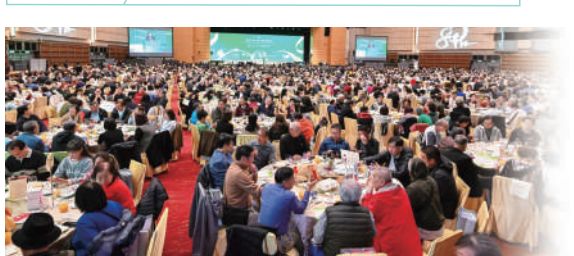
▲超過2000名嘉賓校友出席，場面熱鬧。