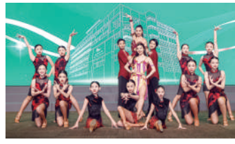
▲漢華中學拉丁舞香港代表隊成員與隊員們表演《風華舞韻》。