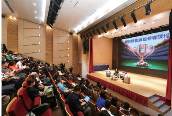
▲計劃合作夥伴之一的廉政公署舉辦課程重點講解反賄賂法規及最佳實踐。

「賽馬會體育管治能力提升計劃」及「賽馬會香港公司治理公會體育治理計劃」的重點內容包