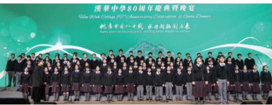
▲中學部合唱團以《漢華頌歌》為慶典拉開序幕。