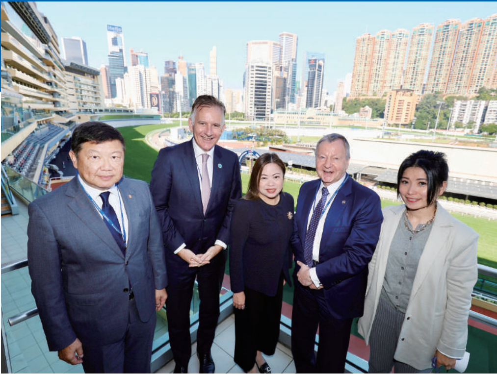
▲香港特別行政區政府文化體育及旅遊局局長羅淑佩（中）、香港賽馬會行政總裁應家柏（右二）、香港公司治理公會會長司馬志（左二）、港協暨奧委會義務秘書長楊祖賜（左一），及廉政公署防止貪污處助理處長王嫻（右一）出席體育管治及誠信國際論壇。

由馬會支持的體育管治及誠信國際論壇，已於12月初在跑馬地馬場舉行。今年的論壇雲集全球知名講者，以及超過160名來自本地體育總會及體育界的代表，探討如何提升本地體育誠信實踐和規範。