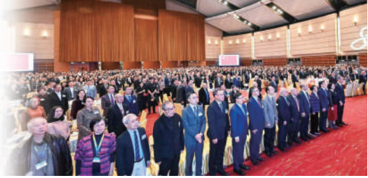
▲全場肅立，奏唱國歌。