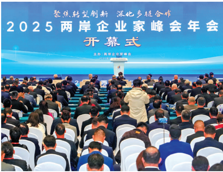
▲2025兩岸企業家峰會年會16日在江蘇南京開幕。