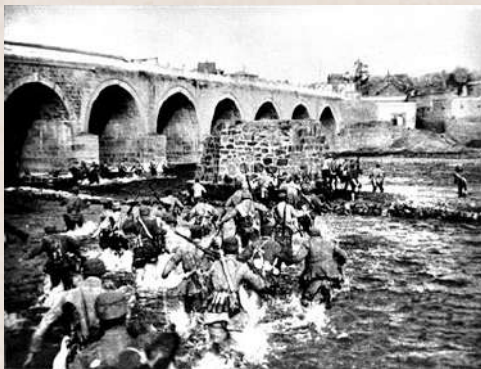
◀1947年，解放軍戰士強渡微水（新牆河），向敵軍發起攻擊。