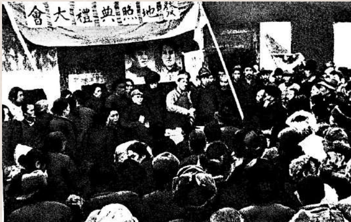
◀解放區人民政府頒發地照（土地執照）給農民。

土地制度改革，是中國共產黨領導中國人民從根本上推毀中國封建制度根基的社會大變革。它讓佔中國人口絕大多數的農民進一步認識到，中國共產黨是他們利益的堅決維護者，因而自覺地在黨的周圍團結起來，這就為打敗蔣介石、建立新中國奠定了最深厚的群眾基礎。