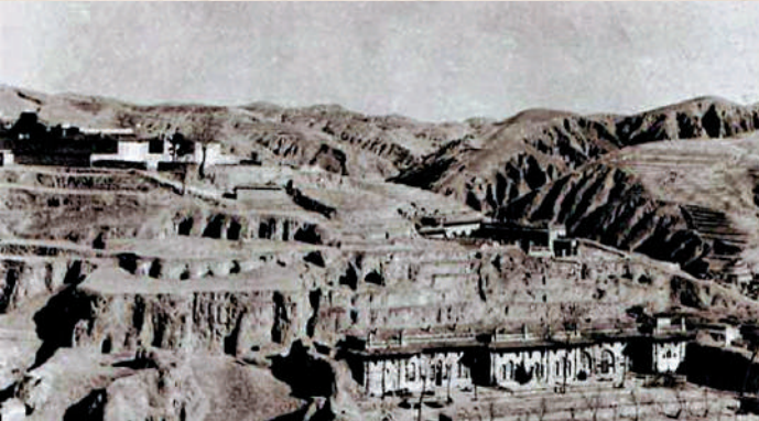
▲1947年12月25至28日，中共中央在陝北米脂縣楊家溝召開擴大會議。圖為會議會址。

1948年1月，沈鈞儒等在香港召開民盟一屆三中全会恢復民盟總部，表示今後要與中國共產黨攜手合作。與此同時，中國國民黨革命委員會也公開表示承認中國共產黨的領導地位，其他民主黨派也明確表示了參加新民主主義革命的立場。