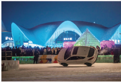
▲冰上汽車芭蕾舞，激情藝術與技藝的碰撞。