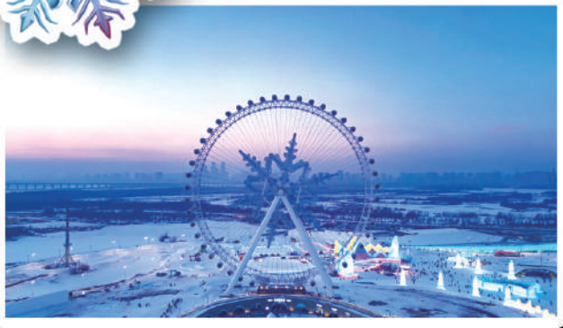
▲雪花摩天輪浪漫升級。