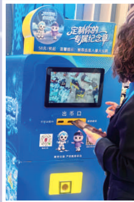
▲AI文創打印，給游客更多驚喜體驗。

「蒸汽火車」與「高鐵動車」造型冰雕，車廂內部建有生動的人物互動冰雕，還原不同時代的列車風貌，將城市從鐵路興起到現代化騰飛的變遷具象化，讓時代的印記在冰雪世界中清晰可見。尤其值得一提的是，蒸汽火車還將生動還原歷史，應用科技手段，對聲音和噴氣進行展現。