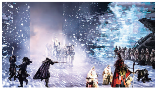
▲大型奇幻秀《王的戰車》全新演繹升級。

運營期間，將舉辦《如歌的旅程》跨年演唱會、第42屆中國·哈爾濱國際冰雪節開幕式、第37屆哈爾濱國際冰雕比賽、黑龍江省第三屆職業技能大賽冰雪經濟領域專項賽、冰超·全國大眾雪地足球挑戰賽、冰超·東北三省室外冰球挑戰賽、冰盤比賽、冰壺比賽等，豐富游客游玩體驗。