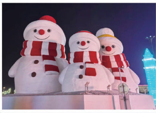
▲童話雪人三口之家，親切接待八方游客。