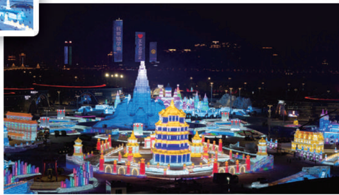
▲第二十七屆哈爾濱冰雪大世界園區佔地120萬平方米，規模為歷屆之最。