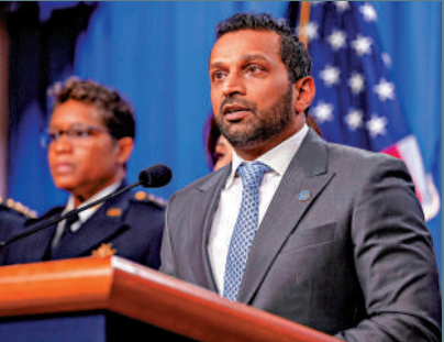
▲ FBI局長帕特爾上任以來爭議不斷。

此外，帕特爾還被曝多次動用公共資源，為其女友提供安保和便利。本月早些時候的一份報告顯示，FBI在職人員及近期離職人員均表示，帕特爾「無法勝任」局長一職，他在FBI內部營造出「不聽從上級指令就可能遭解僱」的氛圍，其領導下的FBI正逐漸「陷入癱瘓」。帕特爾在被任命出任FBI局長前，從未擔任過FBI特工，也沒有擔任過任何高級執法管理職務。