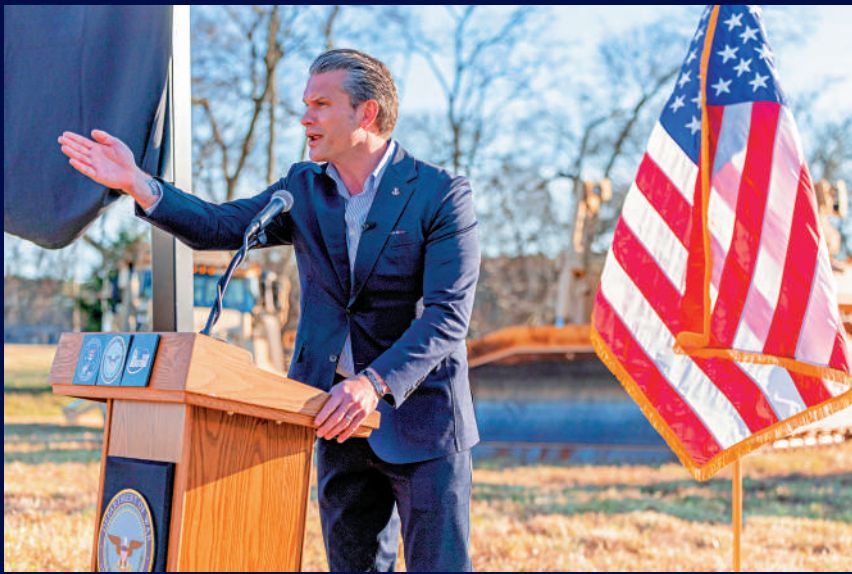
▲海格塞斯要求五角大樓進行改革，以配合特朗普政府的安全戰略。

美媒15日援引知情人士披露，五角大樓高級官員正在制定一項機構重組計劃，美軍作戰司令部的數量或將從11個減少到8個，四星上將人數也將減少。報道指出，這將是美軍高層權力結構數十年來經歷的最重大調整，旨在配合美國總統特朗普從中東和歐洲抽調資源、聚焦西半球軍事行動的新政策。知情人士表示，五角大樓幾乎沒有向國會透露相關計劃的細節，令共和黨控制的參眾兩院軍事委員會感到不安。