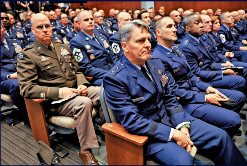
▲五角大樓正在制定機構重組計劃，預計將進一步削減將領人數。