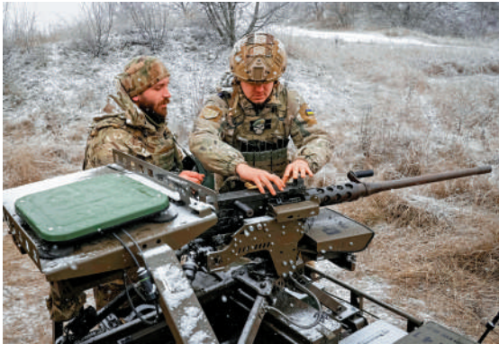
▲烏克蘭士兵15日在俄烏衝突前線測試武器。

澤連斯基15日做出妥協，表示烏克蘭放棄加入北約，換取美歐提供安全保障。美國官員透露，美烏接近達成類似於北約第五條集體防禦條款的安全保障協議，雙方已就「90%的議題」達