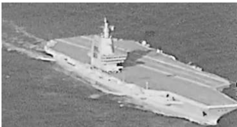
▲台軍F16V的偵察吊艙拍攝到通過台灣海峽的福建艦。

解放軍三航母礪劍深藍，中國海空聯合立體威懾態勢持續增強。日前，中俄聯合空中戰略巡航首次與遼寧艦航母編隊在西太平洋的遠海訓練同時進行。日媒披露，遼寧艦編隊最近時距離九州島僅約400公里，「中國航母在日本西南島嶼周邊演訓常態化」成為熱話。