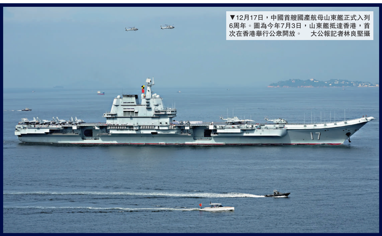
▼12月17日，中國首艘國產航母山東艦正式入列6周年。圖為今年7月3日，山東艦抵達香港，首次在香港舉行公眾開放。

●2020年5月，山東艦開始出海執行軍事任務，這是它入列後首次航行訓練，標誌着山東艦已經初步形成戰鬥力。