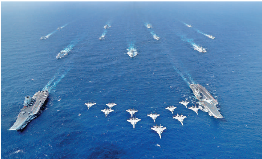
▲2024年10月下旬，海軍遼寧艦編隊開展遠海實戰化訓練。其間，遼寧艦（右）、山東艦（左）編隊首次開展雙航母編隊演練。新華社

12月11日的外交部例行記者會上，發言人郭嘉昆在回應關於中俄聯合巡航的問題時表示，此次中俄聯合空中戰略巡航，是年度合作計劃的項目，展示了雙方共同應對地區安全挑戰、維護地區和平穩定的決心與能力。日方沒必要大驚小怪、對號入座。晚間，微博號「人民空軍」發布海報，配文分別是「大驚小怪，認清常態！」和「對號入座，做賊心虛！」中日雙語喊話日本。