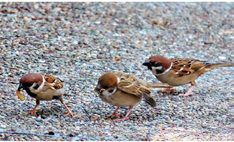
◀麻雀是香港最常見的鳥類之一，和人類的關係密切。