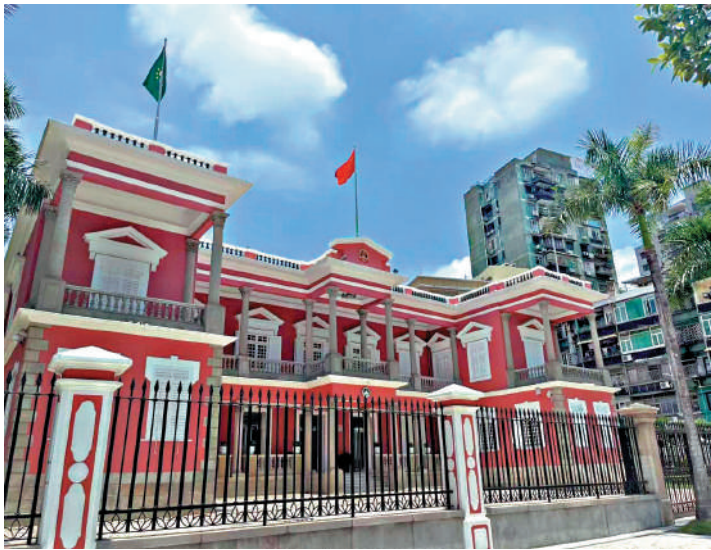
◀學者認同澳門特區政府過去一年施政理念。