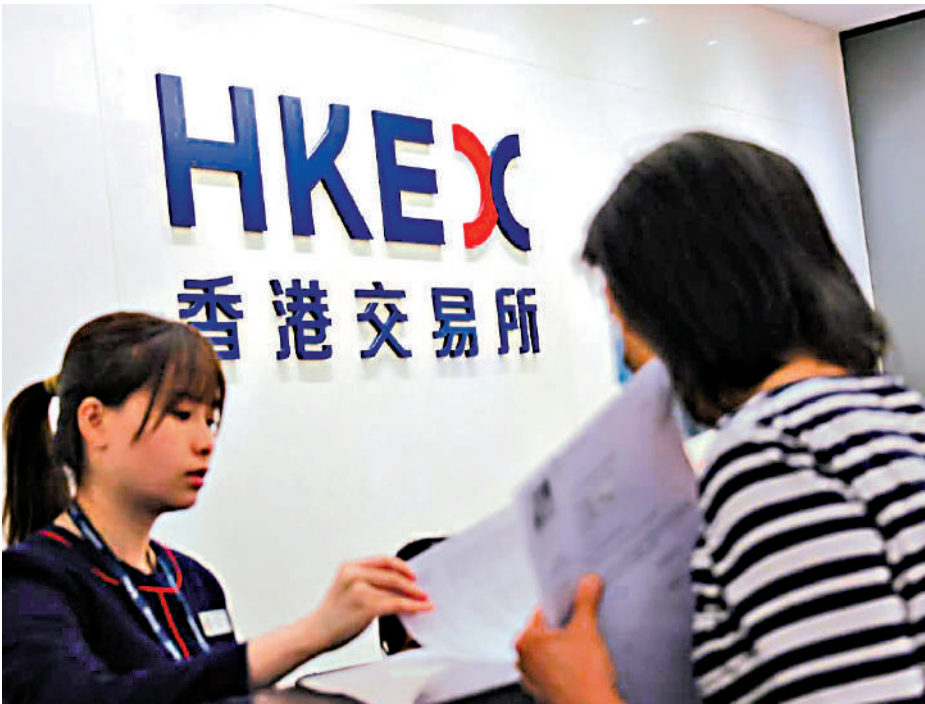
▲ 每手股數改革諮詢總結明年上半年刊發。