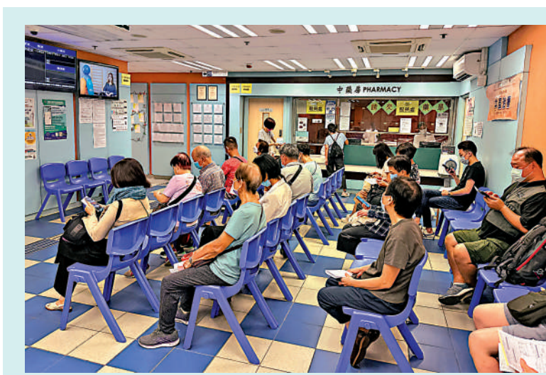
▲《中醫藥發展藍圖》勾畫香港中醫藥發展願景，讓市民享有更全面的醫療服務。