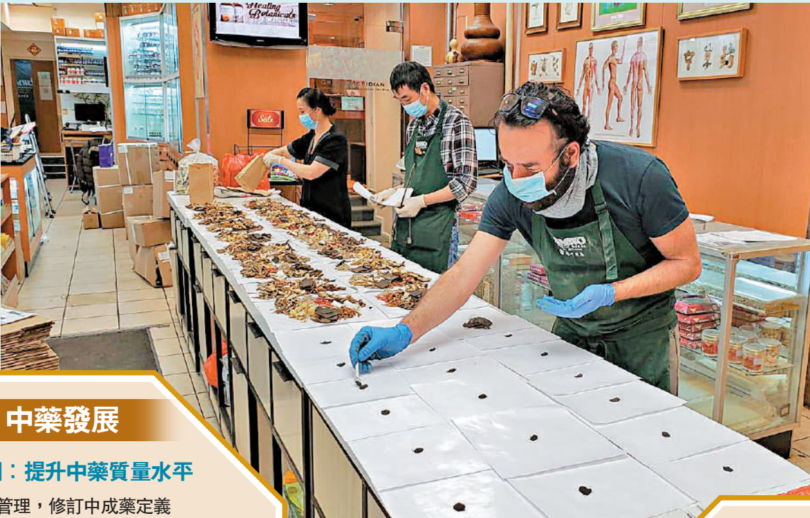
▲中醫藥文化在全球日趨流行，愈來愈多外國人相信中醫藥效用。