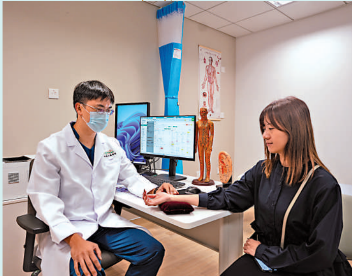
►中醫醫院於本月11日起分階段投入服務，是香港中醫藥發展的一個重要里程碑。