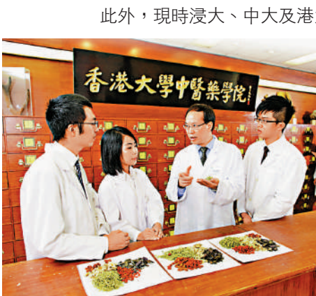
▲《中醫藥發展藍圖》提出設立專責小組，優化由本科課程、執業後臨床培訓，到持續進修機制等的培養體系，培育中醫藥人才。

醫衛局表示，參與培訓對中醫師個人而言，明確核心能力後，其職業發展路徑會更清晰；對市民而言，中醫人才培訓會更加標準化、專業化，能讓市民接觸到更多優質中醫服務；對本港三所中醫院校而言，教學目標會更清晰，不論本科、碩士、博士課程，都能依據能力標準進一步優化。