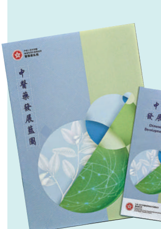
▲特區政府昨日公布首份《中醫藥發展藍圖》。