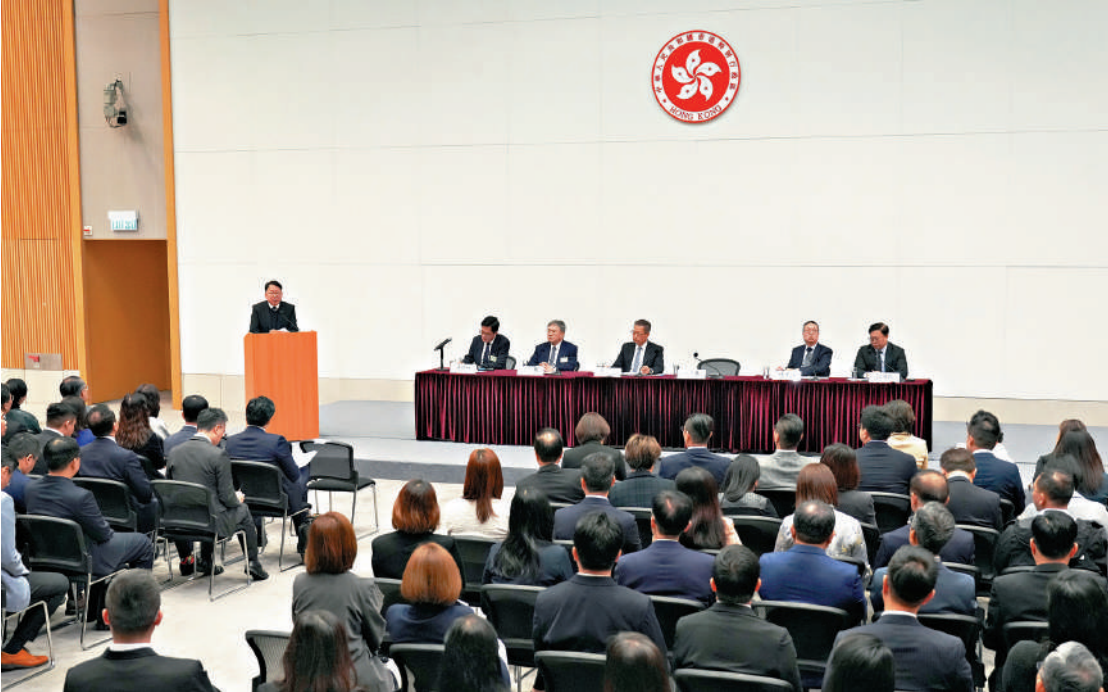
▲特區政府與第八屆立法會候任議員交流會昨日舉行。六位司長、副司長以及約七十名候任立法會議員出席。

他表示，香港正處於對接國家「十五五」規劃、全面邁向由治及興的關鍵歷史節點。要將宏偉藍圖轉化為發展成果，關鍵在於凝聚共識、群策群力。強化行政立法關係，不只是提升治理效能的基礎，更是香港把握國家戰略機遇、激發自身發展動能、解決深層次問題的必要元素。