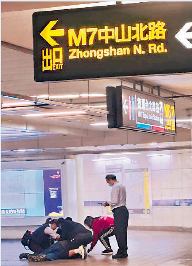
◀台北警方在現場展開採證調查。