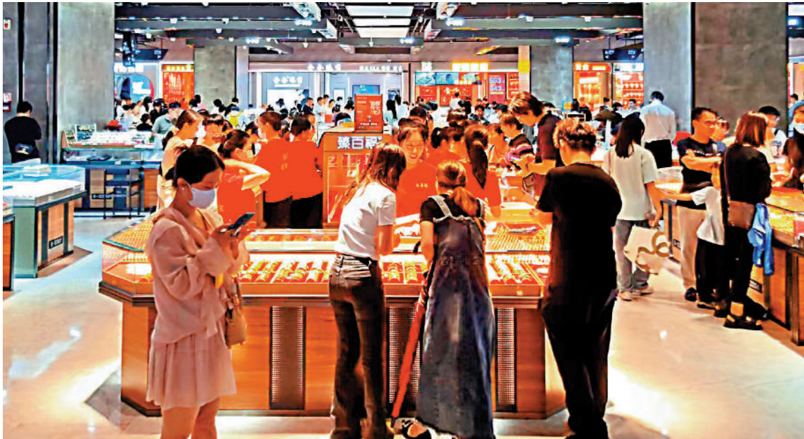
▲水貝黃金市場裏人頭攢動，每間商舖都擠滿了詢價的顧客。

到不少類似的故事，再打量這位「親戚」頭戴鴨舌帽，臉也被口罩遮住，行跡十分可疑。他果斷拒絕提貨，想退款給買家，結果用微信剛溝通兩句，就被對方拉黑了。