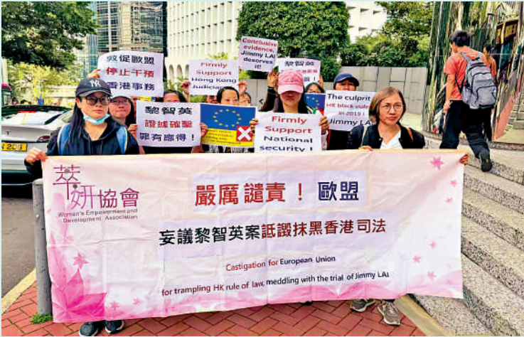
▲市民認為黎智英罪有應得，堅決支持香港特區司法機關的公正判決。