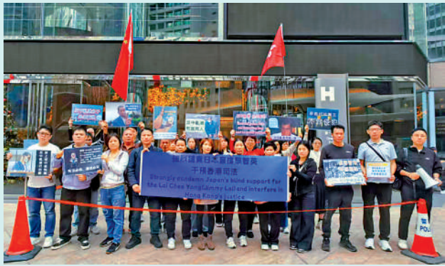
▲▲昨日有團體先後到歐盟駐港辦事處、加拿大駐香港總領事館、日本駐香港總領事館等抗議，強烈譴責七國集團及歐盟安議黎智英案，詆毀抹黑香港法治。