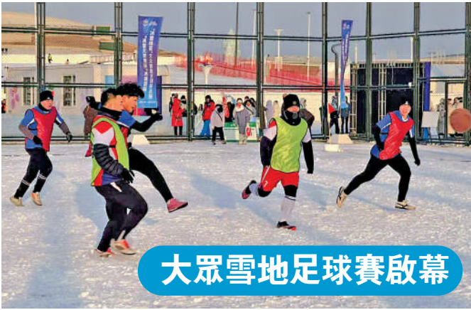
大眾雪地足球賽啟幕

【大公報訊】記者于海江、王欣欣哈爾濱報道：備受矚目的哈爾濱市「冰超」系列冰雪賽事啟動儀式暨「冰雪大世界盃」2025—2026年冰城首屆「冰雪綠茵」大眾雪地足球挑戰賽20日啟幕並迎來首場比賽。本次賽事將專業競技與大眾狂歡完美交融，面向全民開放，參與者不限於資深足球愛好者，任何對雪地足球感興趣的人都可以報名參加。