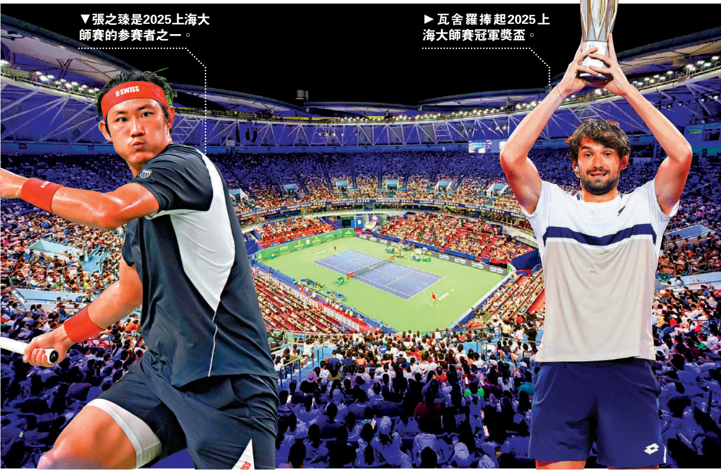
▼張之臻是2025上海大師賽的參賽者之一。

久事國際網球學院則定位於集網球競訓、教育服務和賽事活動於一體的國際化網球學院。學校將堅持「體教融合」的辦學理念，引入國際頂尖教練團隊，並配備科學完善的康復與體能支持體系。未來，學院還將組織青少年網球系列賽事、訓練營、海外研學等活動，為中國青少年網球選手打造與世界接軌的成長路徑。