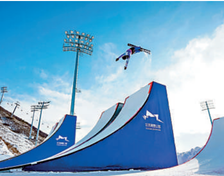
▲國際雪聯自由式滑雪空中技巧世界盃崇禮站在20日舉行。