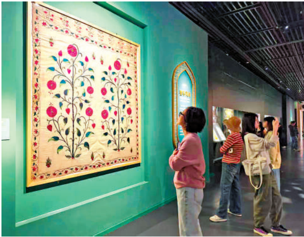
▲「繁花與利劍——16-19世紀莫卧兒宮廷珍寶展」展廳一隅。

其中一件展品為《哈姆扎傳奇》的插圖，生動地描繪了英雄哈姆扎帶領軍隊攻奪法蘭克人堡壘的戰爭場景。據