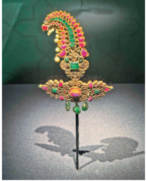
◀鑲寶石珙瑯薩佩奇。