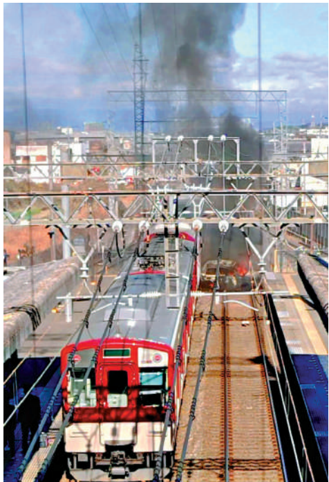
▲日本京都府精華町20日發生列車與汽車相撞事故。

就汽車為何滯留在鐵路口等情況展開調查。受事故影響，近鐵京都線部分線路已暫停運行。