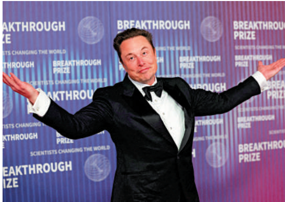
▲特斯拉創辦人馬斯克在2018年的薪酬方案獲特拉華州最高法院放行。

上述裁決不影響特斯拉股東近期批准的馬斯克最新薪酬方案。11月6日，特斯拉股東已投票通過馬斯克的1萬億美元薪酬方案，要求馬斯克在10年內帶領特斯拉達成12項目標，全部達成後其個人持股量將達到25%或更多。不過，特斯拉今年以來營收下滑且安全問題頻出，馬斯克政治立場也拖累特斯拉銷量，引發外界強烈質疑。