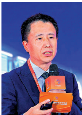
▲時衛干表示，深港兩地將啟動黃金領域合作，助力香港打造國際黃金交易中心。