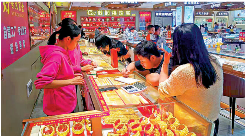
▲深圳水貝黃金交易中心一隅。

時衛干稱，最近在深港金融合作委員會第三次會議上，深圳市地方金融管理局與香港特區政府財經事務及庫務局簽署了《關於推進深港黃金領域合作的備忘錄》，推動黃金倉儲與物流網絡協同；支持香港拓展黃金倉儲，共同推動保險、檢