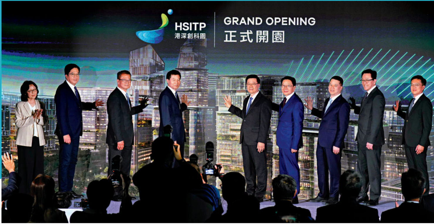
▲12月22日，河套香港園區開幕，特區行政長官李家超、國務院港澳辦分管日常工作的副主任徐啟方、中央駐港聯絡辦主任周霽、深圳市副市長羅晃浩等出席開幕儀式。