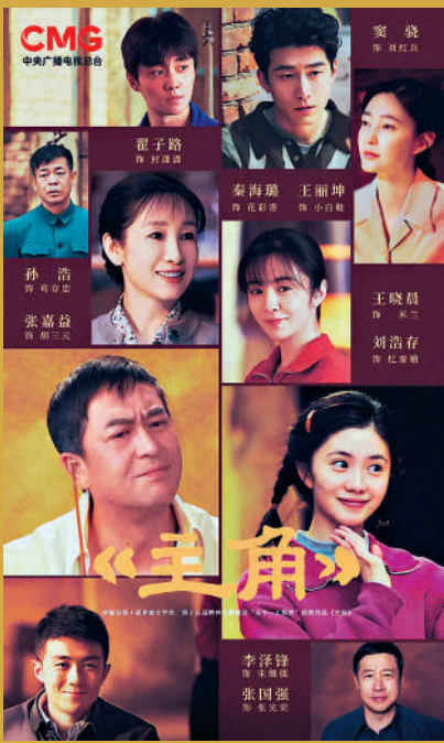
▲根據陳彥同名小說改編的電視劇《主角》由張藝謀擔任監製。