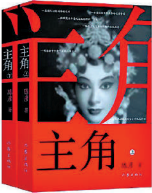
▲《主角》，陳彥著，作家出版社。

日子，且不是一天兩天，如此艱苦的條件，他們卻要用半年時間去拍攝這個年代劇。那種苦，恐怕連我也是吃不了的。」陳彥透過《大公報》表示，對他們的勞動創造深懷敬重，作為原著作者，期待電視劇拍得更精彩。