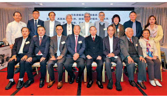
▲「藝術香港」昨日舉行「十載芳華 藝韻永續」十周年慶典晚宴。

兩項重大活動：一是牽頭成立了香港書畫藝術導師協會並北上廣州文化公園舉辦了書畫展覽，二是申請了國家藝術基金，成功辦起了香港中小學教師書法培訓班，培養一大批書法老師的在職技能。