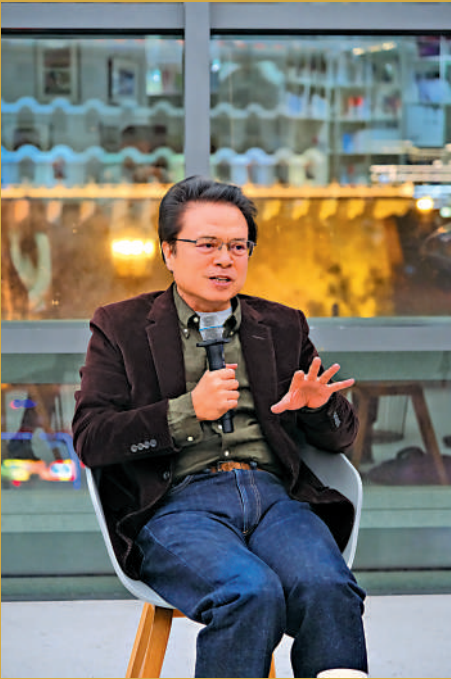
▲作家陳彥在《人間廣廈》新書發布會上。

陳彥，中國作協常務副主席、中國戲劇家協會副主席，著有《大樹西遷》《西京故事》等數十部戲劇作品，三次獲「曹禺戲劇文學獎」；著有長篇小說《西京故事》《裝台》《主角》《喜劇》《星空與半棵樹》，三次（2015、2018、2023年）獲得年度「中國好書」，《主角》獲第十屆茅盾文學獎，多部作品在海外多語種發行。