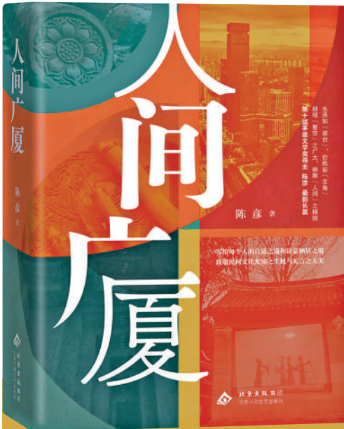
▲陳彥長篇新作《人間廣廈》，北京十月文藝出版社。

「我們欣賞文藝作品越來越陷入了只想了解個大概的程度，有時似乎看看『說明書』就夠了，不想進入細節。」陳彥提醒，文學藝術的奧妙，恰恰在豐富的細節上。增加欣賞細節的耐心，則能讓我們不被「短、平、快」的浮躁牽着鼻子走。