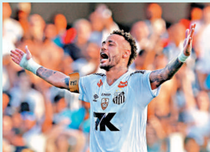
▲尼馬期望出席明年的世界盃。資料圖片

這次手術是尼馬爭取參加個人可能最後一屆世界盃的關鍵一步。未來6個月，他在山度士的表現將至關重要，他必須證明自己已完全康復，並能適應高強度比賽，方能打動教練安察洛堤，踏上世界盃舞台。