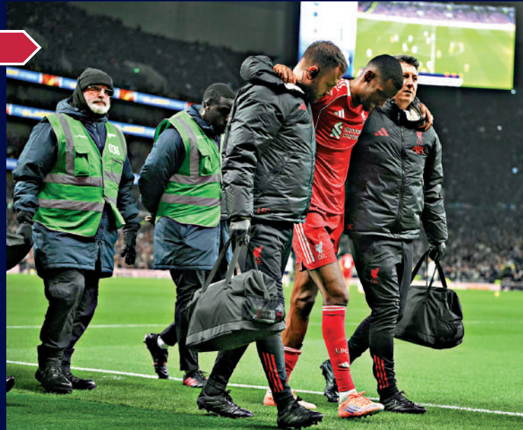
▲20日，伊沙克（右二）由醫療人員扶離場。

●出生日期：1999年9月21日（26歲） | ●身高：1米92 ●位置：前鋒 | ●國籍：瑞典 | ●效力球隊：利物浦