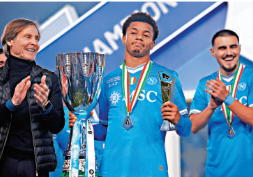
▲拿尼斯（左二）獲選意超盃決賽最佳球員。

拿尼斯在上半場第39分鐘禁區外射入世界盃先開紀錄，隨後在下半場第57分鐘把握對方門將失誤再下一城。他在今屆賽事兩場比賽中共攻入3球，成為球隊奪冠的最大功臣。拿玻里主帥干地賽後表示，全隊展現出強烈的奪冠欲望，這個獎盃讓所有人都能度過一個美好的聖誕節。