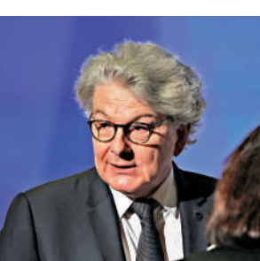
▲布雷東此前是歐盟委員會負責內部市場的委員。

【大公報訊】據新華社報道：美國國務院23日發布公告，對包括歐盟委員會前委員布雷東在內的5名歐洲人士實施旅行限制，禁止其進入美國，指他們試圖迫使美國科技公司審查社媒平台上的政治言論。歐盟委員會發言人24日表示，歐盟委員會強烈譴責美國此舉，或將採取反制措施。 布雷東於2019年開始擔任歐盟委員會負責內部市場的委員，2024年9月辭職。他23日表示，美國拒絕向包括他在內的5人發放簽證是「政治迫害」。 輿論認為，美國此次對布雷東等5人實施簽證限制，或與美國和歐盟在數字監管等領域的摩擦有關。歐盟委員會本月5日根據《數字服務法案》作出首份「不合法決定」，對美國億萬富翁馬斯克名下社媒平台X罰款1.2億歐元。美國貿易代表辦公室16日表示，如歐盟堅