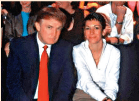
▲23日公布的檔案中包含特朗普與愛潑斯坦前女友麥克斯韋爾的合照。

還有網友直接在X平台發布如何「還原」塗黑文字的視頻，同時嘲諷美國司法部「把一些文件的塗黑處理搞得糟糕透頂，以至於你可以恢復它們，我只是簡單地通過複製、黏貼文本就做到了」。目前尚不清楚有多少被塗黑的內容可以通過這一操作「重現原形」。