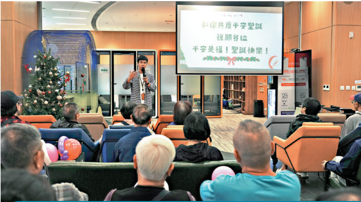
◀元朗青年綠洲為大埔宏福苑居民舉辦聖誕活動，傳遞節日溫暖。

「無論是長者、返工的人，或者小朋友，他們都可以堅強地面對，那麼我們作為局外人、不受事件直接影響的人，又為何不能樂觀面對呢？其實不一定要沉浸在負面情緒中，在逆境中保持正面心態，這反而是各位居民們教識我的。」嘉皓說。