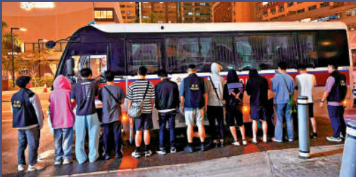
▲警方今年11月6日在新蒲崗一工廠大廈搗破一個德州撲克賭枱，拘捕11人。