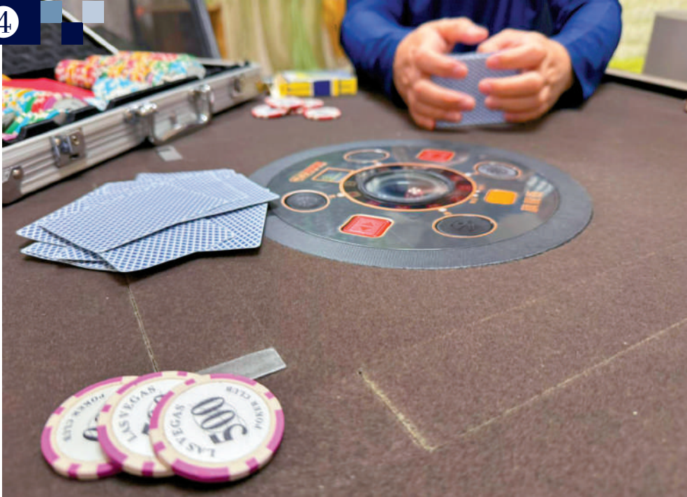
▲有派對房間提供賭具，部分更提供德州撲克枱及籌碼。