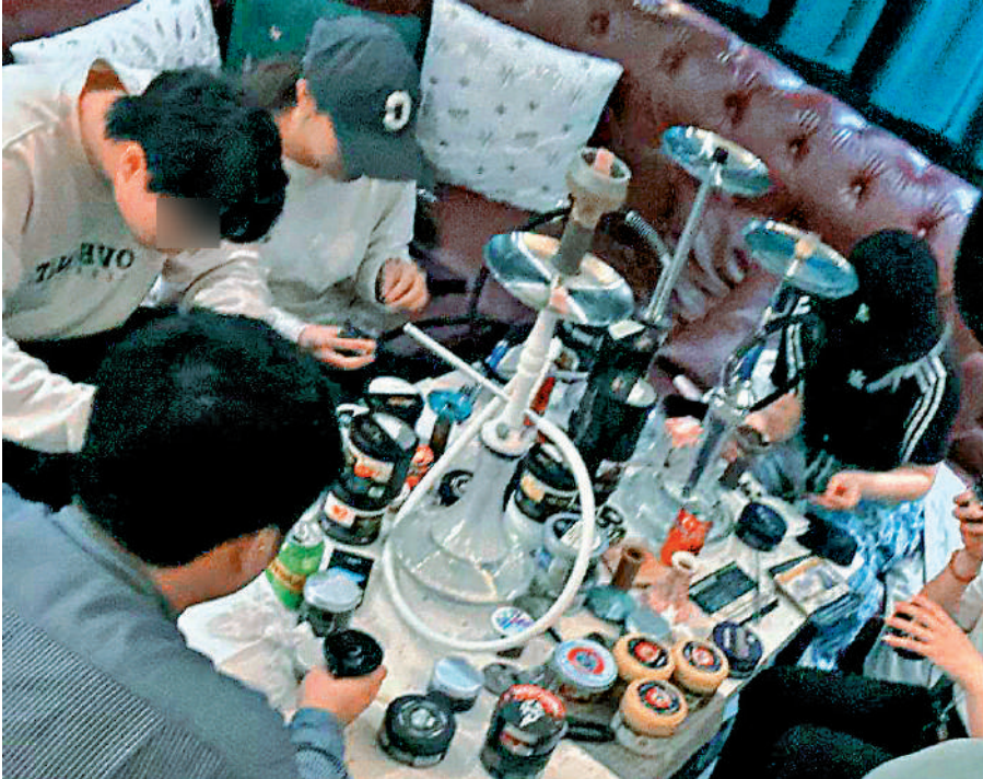
▲有人將在工廈酒吧內吸食水煙的照片放在社交平台炫耀。