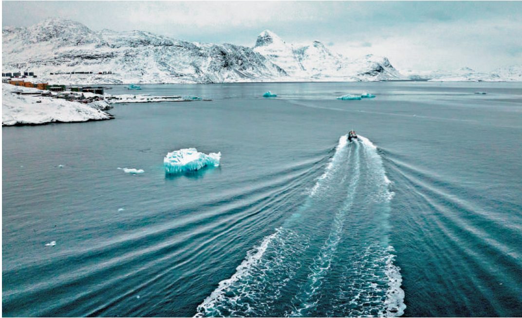
▲格陵蘭島是連接北極地區和北美的關鍵樞紐，具有重要價值。

美國至今保留着格陵蘭島上的皮圖菲克太空基地（原名圖勒空軍基地）。這座基地不僅是最北端的美國軍事設施，也是美國在北極地區的重要前哨。美媒指出，受地球曲率影響，在格陵蘭島部署導彈預警雷達探測距離更遠，覆蓋範圍也更廣。（綜合報道）