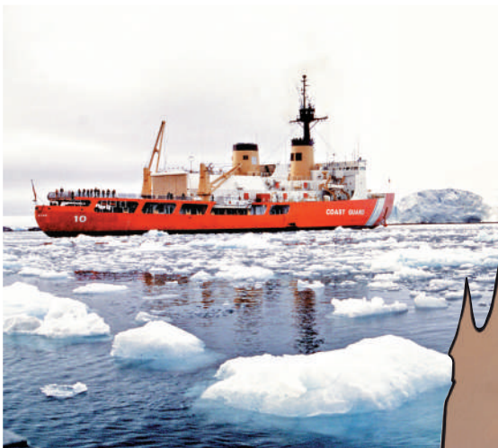
▲「北極星」號是美國唯一一艘重型極地破冰船。資料圖片

建造新的重型破冰船「極地哨兵」號的合同，但美國造船業早已衰落，缺乏工人和基礎設施。據悉，「極地哨兵」號預計要到2030年之後才能完工。今年10月，特朗普宣布將向芬蘭購買11艘中型破冰船，總成本約61億美元。