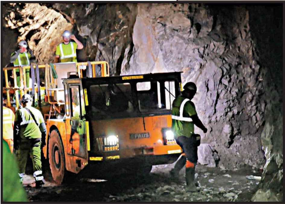
▲格陵蘭島蘊藏豐富礦產資源。圖為島上一座正在開採的路透社。