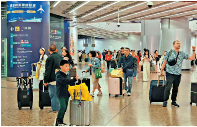
▲大批旅客來港度聖誕，高鐵西九龍站昨日抵港旅客絡繹不絕。