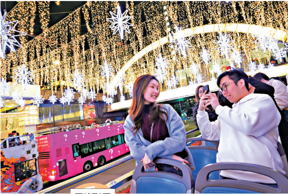
遊人坐開篷巴士以獨特視角觀賞聖誕燈飾，感受濃濃的節日氣氛。