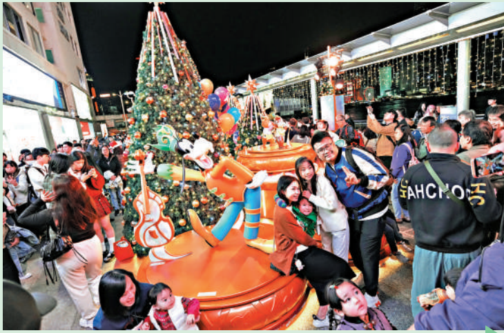
▲尖沙咀聖誕氣氛濃厚，吸引大批市民及遊客駐足拍照。

由珠海來港的旅客陳小姐說，早就做好攻略，一定要聖誕節來香港搭一趟開篷巴士，不僅能觀賞維港夜景，還能一次過遊覽多個大型的聖誕景點，在行程規劃上也比較省事。