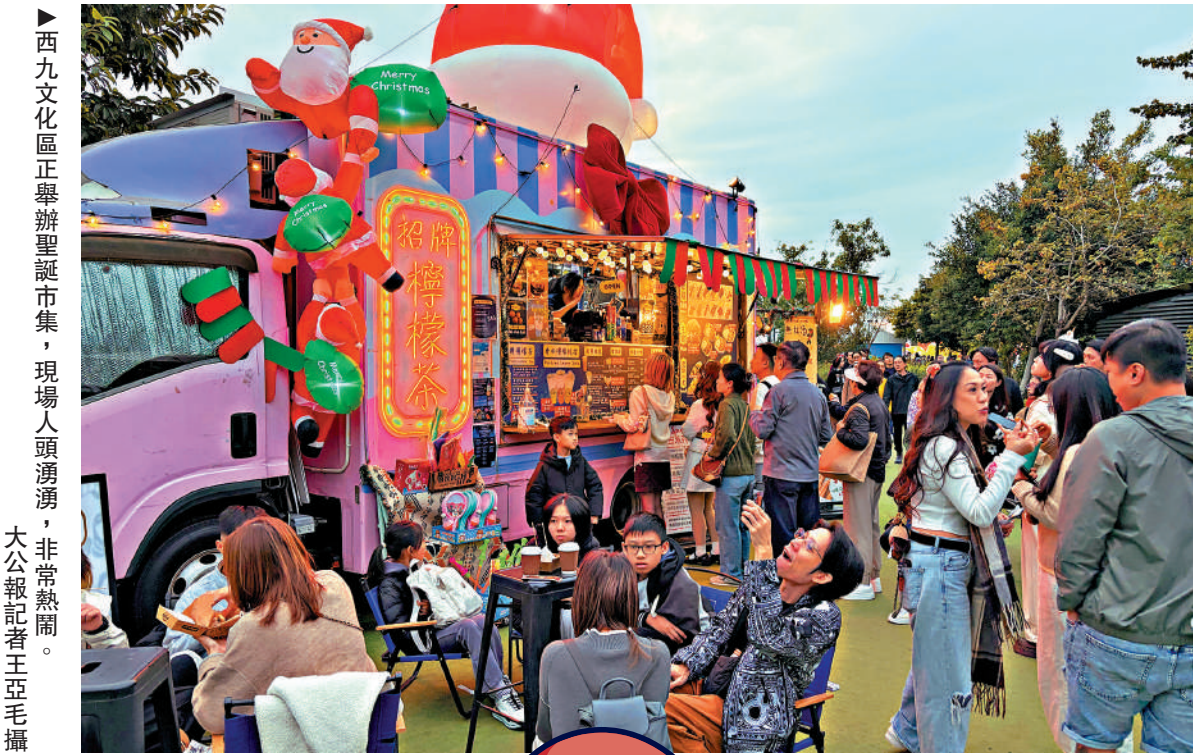
西九文化區正舉辦聖誕市集，現場人頭湧湧，非常熱鬧。 大公報記者王亞毛攝