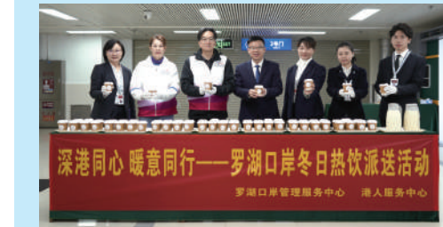
▲羅湖口岸冬日熱飲派送活動順利舉辦。

深港同心 暖意同行 羅湖口岸冬日熱飲派送活動暖心開展 日前，寒潮席卷鵬城，深圳氣溫驟降。深圳市口岸辦牽頭羅湖口岸管理服務中心、羅湖海關及羅湖口岸入境服務中心在羅湖口岸開展「深港同心 暖意同行」冬日熱飲派送活動，為往返深港的旅客送上熱飲，以一杯杯熱氣騰騰的熱飲驅散寒意，用暖心服務架起深港情誼的橋樑。 此次活動由主辦單位精心籌備，制作出驅寒暖身熱飲，給旅客能到深圳入境時享用到溫熱飲品，實現「口岸暖意捧在手心，深港溫情直達心間」。活動當日，各單位志願者們早早抵達羅湖口岸二號門前設立熱飲派發服務點位，志願者用真誠的笑容和貼心的服務為入境旅客傳遞溫暖。一位長者在接過杯子時連聲道謝：「這杯熱茶暖胃更暖心。」短短兩個小時，共派發熱茶600杯，收獲點贊、合影無數。此次熱飲派送活動，既是市口岸辦連同各單位應對寒潮天氣、服務民生需求的暖心舉措，更是深港兩地攜手踐行以人民為中心的發展思想、傳遞同胞溫情的生動實踐。 羅湖口岸作為連接深港的重要樞紐，始終秉持「以人為本」的服務理念，此次聯合羅湖口岸入境服務中心開展活動，既為往來旅客送上實際的溫暖，也進一步拉近了深港兩地民眾的情感距離，詮釋了「守望相助、同心同行」的深厚情誼。據了解，深圳市口岸辦將持續深化與相關單位的協作聯動，聚焦旅客出行需求，策劃開展更多接地氣、暖民心的便民利民活動，全力將深圳口岸打造成為傳遞溫暖、彰顯擔當的文明窗口，為促進深港融合發展貢獻積極力量。