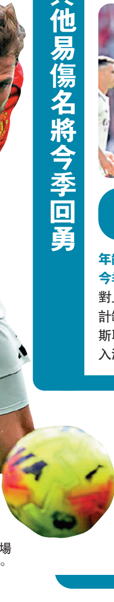
▲曼聯中場美臣蒙特。