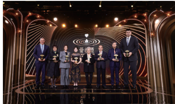
▲第20屆愛心獎八位得獎者合影。

此屆愛心獎由港澳台灣慈善基金會愛心獎主辦，鳳凰衛視協辦及製作、東西方慈善論壇、陳守仁基金會、曉日春暉公益、吳修齊文教公益基金會、吳俊傑慈善公益基金會、台灣現代財經基金會、台北科大校友總會協辦。典禮錄影將於12月底在鳳凰衛視多個頻道、東森衛視、香港TVB等電視台及線上播出。