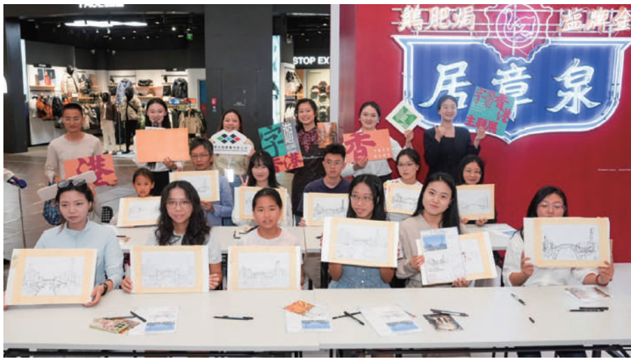
▲深圳市民參加工作坊。

來 初創作家出版資助計劃」下出版的部分作品及第五屆「香港出版雙年獎」的精選獲獎作品。此外，活動以「字」為引，聯通香港的人文歷史，開展涵蓋香港街頭書法、香港街道招牌視覺藝術、香港舊城區人文景觀、香港製香傳統與現狀、香港非遺飲食、張愛玲在香港的生活、港漂生活、筆跡分析等主題作家分享會，以及舉辦港深城市素描、香港當舖夜光招牌製作、香港塔香粒製作、茶藝體驗、STEM創意手作、繪圖示範等主題的互動工作坊，邀請公眾與近30位香港專家、作家、插畫家交流。